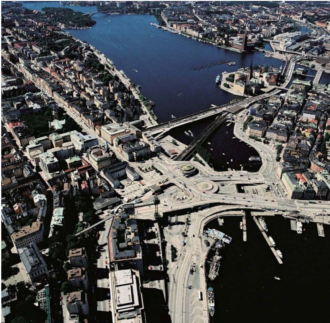
Slussen idag, vy mot väster med Södermalm till vänster och Gamla stan till höger i bild.

Planen syftar till att möjliggöra ombyggnation av Slussenområdet med nya publika platser, gator och kajer, ny- och ombyggnation av funktioner och ytor kopplade till kollektivtrafiken samt reglera byggrätter för ny bebyggelse. Planen syftar också till att möjliggöra nybyggnation av slussränna samt nya avbördningskanaler från Mälaren till Saltsjön.