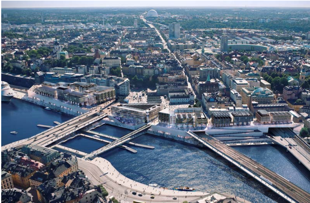
Plansamrådsförslag från januari 2010, flygvy över Slussen mot söder. Bild: Foster+Partners och Berg Arkitektkontor.

bemöta och ta hand om de synpunkter som lämnats in under plansamrådet samt därefter genomföra utställning.