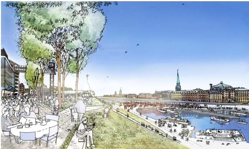
I öster avslutas Slussen med den nya Katarinaparken som sträcker sig ned till kajen med angröping för båttrafik. Till vänster syns den föreslagna bebyggelsen, byggnad E1 och E2. Mellan träden syns Katarinahissen och i bildens högra del syns Gamla stan med kyrktorn. Både hissen och kyrktornen kommer även i framtiden utgöra viktiga riktmärken i stadsbygden kring Slussen. Bild: Foster+Partners och Berg Arkitektkontor.