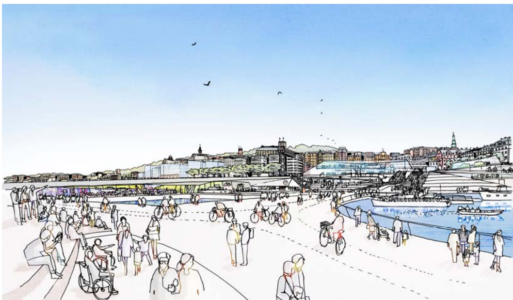
Slussen sett från Gamla stan. Vattenytan öppnas upp, nya byggnader med publikt innehåll och nya torg och park, gator och kajer utgör grunden för en attraktiv mötesplats i det framtida Stockholm.

I visionen om framtidens Stockholm har Slussen en viktig plats. Historiskt är det platsen där staden växte fram mellan landvägen och vattenvägen och det är här, i Gamla stan, som stadens ursprung finns. På denna plats kommer i framtiden det växande Stockholm ges en självklar och vacker mötesplats, en urban scen för gamla och nya Stockholmare, en nod för trafik och en modern bytespunkt mellan olika kollektivtrafikslag. Slussen kommer att vara en mycket viktig del av stadens offentliga rum i framtiden, och ett mycket attraktivt sådant. Detta är utgångspunkten för hur framtidens Slussen formas och det som ligger till grund för planen för framtidens Slussen.