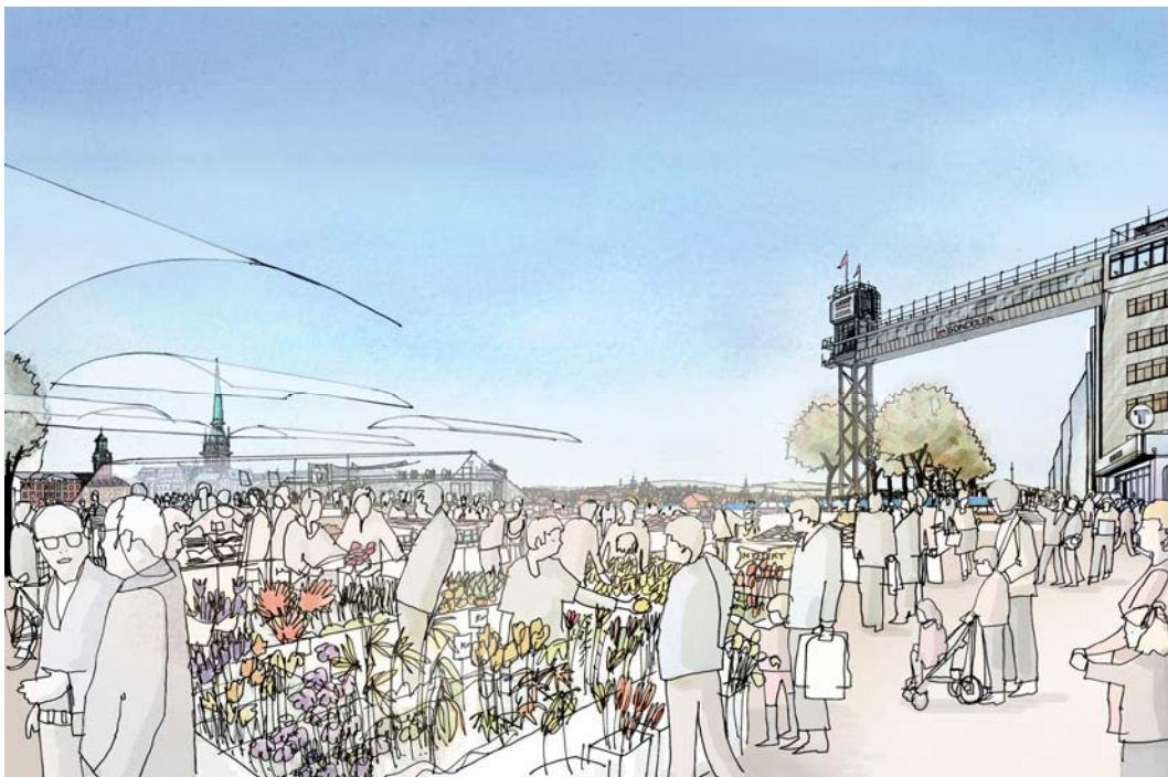
Torghandeln på Ryssgården kan utvecklas i framtiden. I förlängningen av Peter Myndes Backe, under restaurang Gondolen, når man Katarinaparken och Stadsgårdskajen. Bild: Foster+Partners och Berg Arkitektkontor.