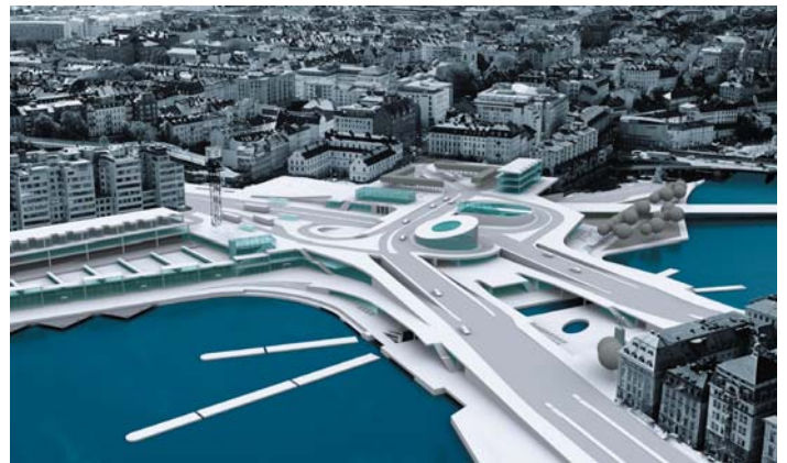
De två förslag som presenterades under programsamrådet; till vänster Nya Slussen och till höger Nybyggt bevarande.

Bild: t.v. Nyréns Arkitektkontor, t.h. White Arkitekter.