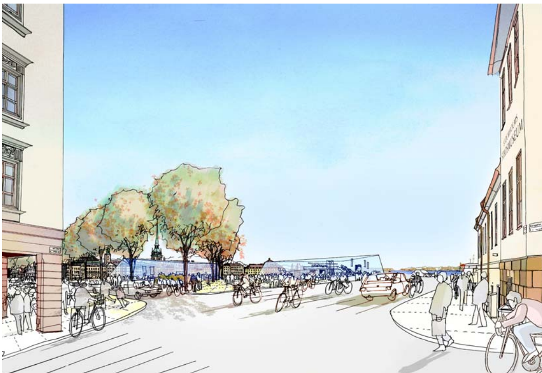
Vy från korsningen Hornsgatan/Götgatan med kvarteret Överkikaren till vänster i bild och stadsmuseet till höger. På Södermalmstorg ses byggnad C2 invid trädraden och byggnad C1 i bildens mitt, intill Hornsgatans förlängning mot huvudbron.

Bebyggelsen i öster utgörs av byggnaderna E1 och E2. Dessa byggnader förhåller sig till parken vid Katarinahissen, till kajen i norr samt till lokalgatan mot KF-