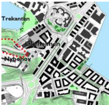
Utsnitt från strukturplanen för stadsutvecklingsprogrammet

Sjövikshöjden till Årstaberg. När alla lägenheter inom stadsutvecklingsområdet färdigställda, rymms de i en blandad stadsbygd; genom en tät kvartersstad i Årstadal-Liljeholmskajen och en öppnare struktur på bergen ovanför på Sjövikshöjden, i kv. Årstaberg och på Nybodahöjden.