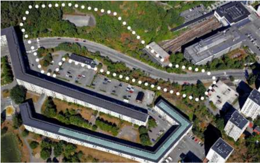
Flygfoto över planområdet sett från söder

Planområdet är beläget i ett attraktivt och kollektivtrafikhögt läge och möjliggör genom den nya bebyggelsen en mer stadsmässig gata som tydligare kopplar samman Nybohov och Liljeholmen. Förslaget innehåller totalt femton hus med 175-190 nya lägenheter, garage med parkering för de tillkommande lägenheterna, verksamhetslokaler, samt en förskola för cirka 160 barn. Den nya bebyggelsen ska utgöra ett kvalitativt nutida komplement till det befintliga området på Nybohovshöjden.