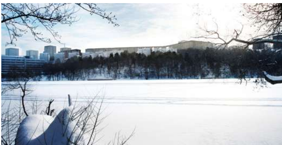
Vy mot söder från sjön Trekantens norra sida