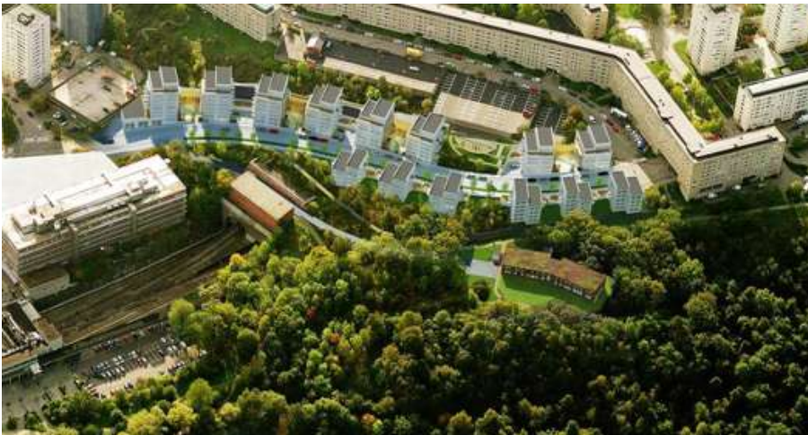
Flygvy från norr, illustration över planförslaget enligt ny utställning