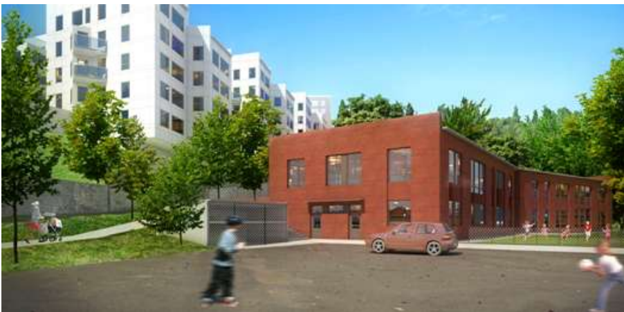
Förskolebyggnad på före detta bollplanen