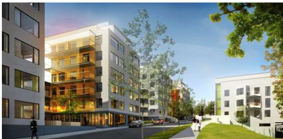
Vy längs Nybohovsbacken mot väster

Den nya bebyggelsen ska utgöra ett kvalitativt nutida komplement till det befintliga området på Nybohovshöjden. All bebyggelse och utomhusmiljön ska hålla hög arkitektonisk, byggnadsteknisk och materialmässig kvalitet som bidrar till en hållbar och god stadsutveckling.