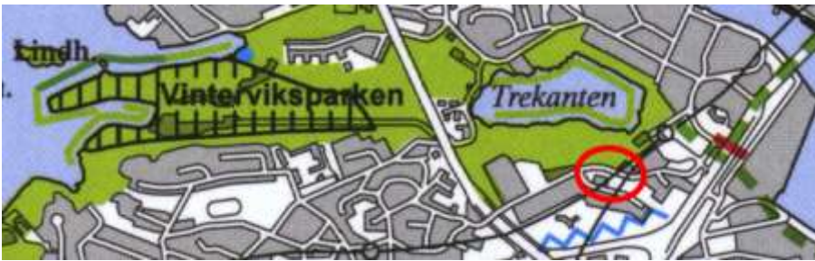
Utdrag ur Stockholms grönkarta