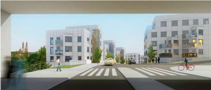
Vy längs Nybohovsbacken mot öster