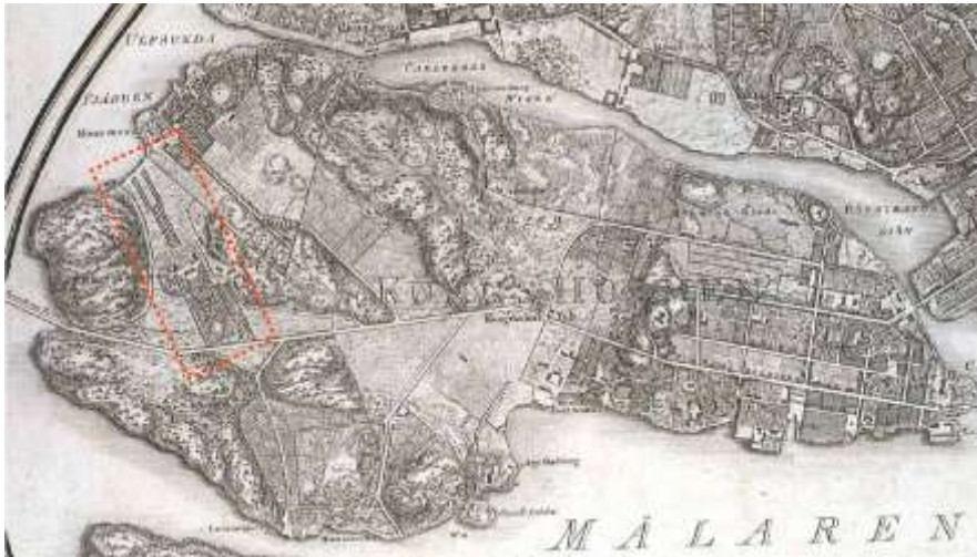
Karta från 1805

Kristinebergs malmgård ägdes och beboddes under en kort tid på 1860-talet av prins August av Dalarna. I samband med det kungliga ägandet får anläggningen namnet Kristinebergs slottspark. 1867 sålde prins August egendomen till frimurarordern som avsåg driva barnhem. De gamla flyglarna revs och ersattes av de nuvarande, vilka inrymde lektionssalar, sovsalar, verkstäder, kök och matsal för 130 barn, och blev därför rejält tilltagna i storlek jämfört med de nätta ursprungliga flyglarna. Ett gymnastikhus i trä byggdes år 1887, vilket ännu finns kvar och används av nutidens elever. År 1907 tillkom nuvarande Kullskolan som logi för flickorna. Barnhemmets fastighet såldes 1928 till Stockholms stad. Slottsbyggnaden har sedan dess hyrts ut som privatbostad, och lägenheterna förvaltas idag av Stadsholmen. Flyglarna omvandlades till folkskola och Kullskolan till småskola, och skolverksamheten har funnits kvar sedan dess i olika varianter.