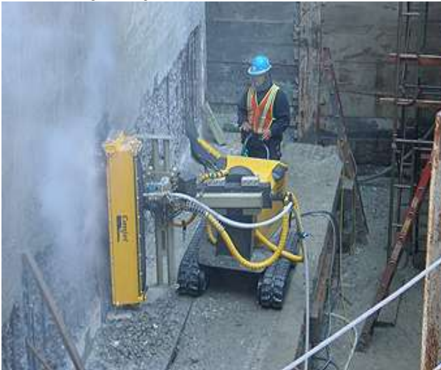
Bilden ovan visar ett vattenbilningsaggregat

Byte av tätskikten sker mitt i Stockholms City med alla de svårigheter det innebär. I stort sett alla trafikslag finns representerade och möts i området. Det ställer mycket höga krav på planering och samordning av framdriften. Säkra trafikanordningar krävs för att trafiken skall kunna flyta under projektet och för att förhindra olyckor och tillbud i och i anslutning till entreprenaderna.