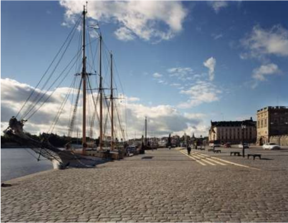
Skeppsbron vid Logården