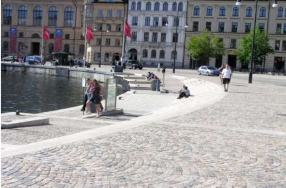
Nybrovikens anslutning till Roul Wallenbergs torg