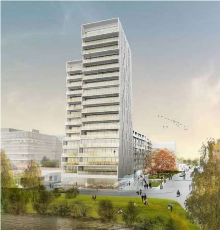
Perspektiv som visar det tvådelade höga huset sett från öster, dvs. från vattnet.