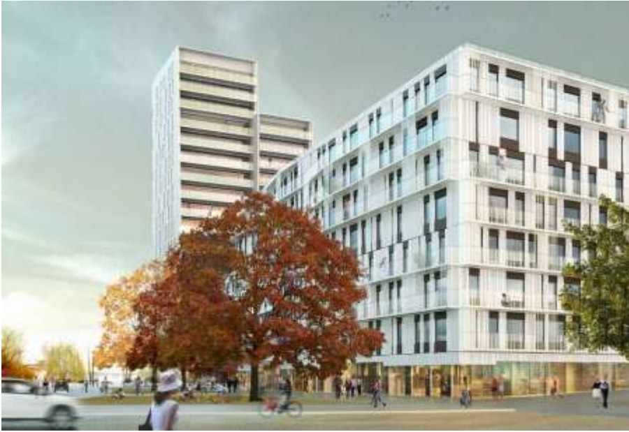
Låghuset sett från Alviks Torg. Kommersiella lokaler i bottenvåningen med ett brett gångstråk/torg framför. De tre stora ekarna bevaras och skyddas i plan.

För grundfastigheten Racketen 10 ändrar planen användningen från industri/kontor till kontor/ickestörande verksamheter och anpassar byggrätten efter nuvarande förhållanden, genom att lägga till sådant som tidigare fått bygglov med mindre avvikelse eller tillfälligt lov. Befintlig industrilokal ersätts av parkeringsgarage i tre plan med terrass ovanpå. Jmf ovan. Inom fastigheten finns en äldre byggnad, den s.k. Vita villan, som är q-märkt i detaljplan sedan tidigare.