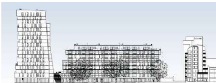
Racketen 11 sett från norr/Gustavslundsvägen. Till höger planerat bostadshus på Racketen 8, och bakom det Scandic Hotel.

Planförslaget följer i princip programförslaget. Befintliga parkeringsdäck på Racketen 11 rivs och ersätts med ca 150 lägenheter i två nya bostadshus med kommersiella lokaler i bottenvåningen; ett högre hus i 18 respektive 15 våningar och ett lägre hus i 8 våningar, med indragen takvåning. Höjden på det höga huset begränsas av inflygningen till Bromma flygplats, + 59,0 meter över stadens nollplan.