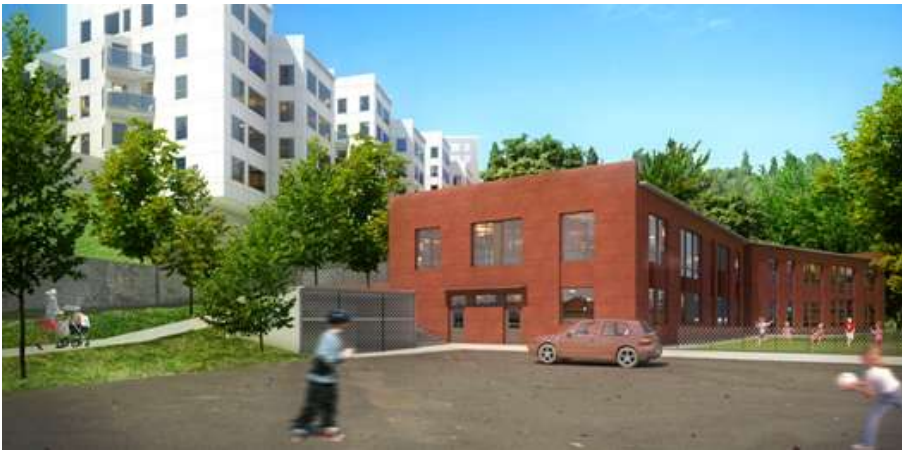
Förskolebyggnad på före detta bollplanen