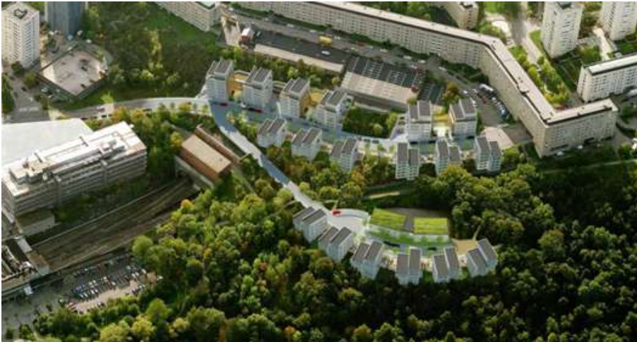
Flygvy från norr, illustration över planförslaget enligt första utställningen