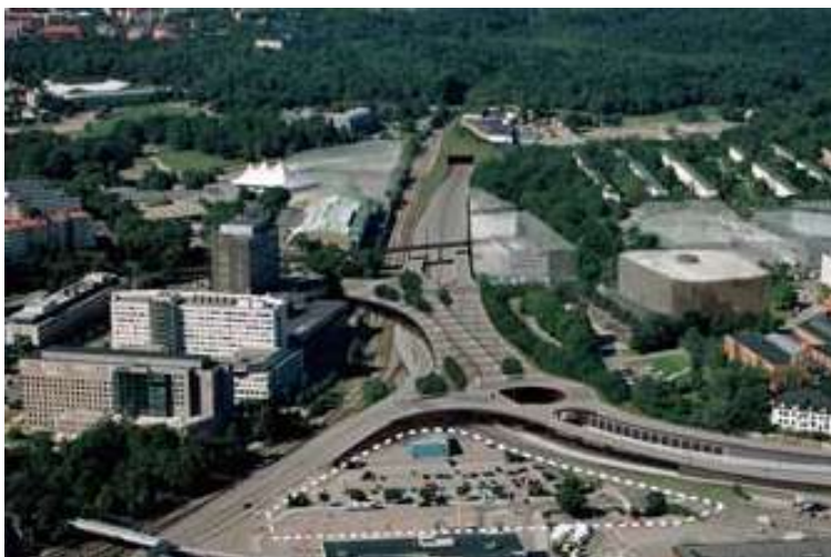
Ett fotomontage som visar hur trafikplatsen är tänkt att se ut vid färdigställandet.

Arbetet med den nya trafikplatsen är mycket omfattande och komplicerat eftersom trafiken i området måste kunna flyta som vanligt under hela byggtiden samtidigt som utrymmet är begränsat. För närvarande har den västra delen av trafikplatsen gjutits och Lidingövägen har lagts upp på den färdigställda delen. Mark och grundläggningsarbeten pågår inom den östra sidan. Dessa arbeten är försenade med i nuläget 3,5 månader.