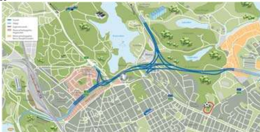
Norra länkens sträckning inkl sträckan Tomtebodavägen - Norrtull

Norra länken utgör den framtida övergripande trafikleden i öst-västlig riktning norr om Stockholms innerstad. Utredningar och analyser av Norra länkens sträckning och utformning har pågått sedan 1960-talet. Sträckning och utformningen har förändrats över tiden. Den senaste förändringen är etappen Tomtebodavägen - Norrtull som är förankrad av utbyggnaden av Norra Stationsområdet. Här byggs en ny stadsdel, Hagastaden. En förutsättning för denna förändring är att väg E4/E20 samt Värtabanan däckas över. Byggnationerna startade 2010.