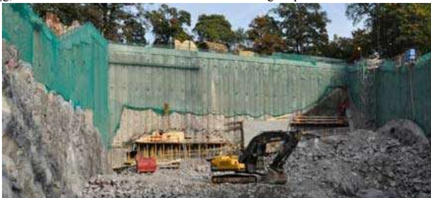
Under Bellevuekullen pågår arbetet med betongtunnelns anslutning till bergtunneln.

Regeringen genomförde 2009 en lagändring av Miljöbalken och en tilläggsplan till gällande detaljplan. Planen möjliggjorde ett tillfälligt ingrepp i Nationalstadsparken vilket innebar att arbetena kunde utföras från ytan med öppet schakt istället för den speciella jordtunnelteknik entreprenören från början avsåg att använda. Den ursprungliga tekniken visade sig efter metodprov ha för stora risker, kostnads- och tidsmässigt. Under entreprenaden används en tillfällig stödkonstruktion, en så kallad sekantpåleväg, för att minska schaktbredden och därmed intrånget i parken.