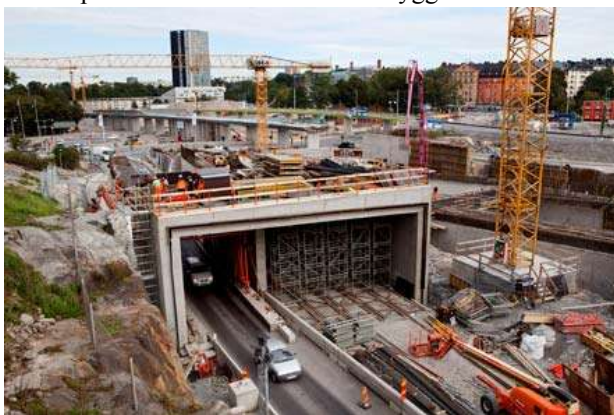
Intunnling och breddning av trafikleden E4/E20 vid Hagastaden samt intunnling av Värtabanan.

Den permanenta järnvägsbron kommer att slutföras under 2012. På grund av trafik- och säkerhetsskäl har den fortsatta byggnationen av blindpelarna under järnvägsbron avbeställts. De pelare som redan har hunnit byggas ska i ett senare skede tas bort.