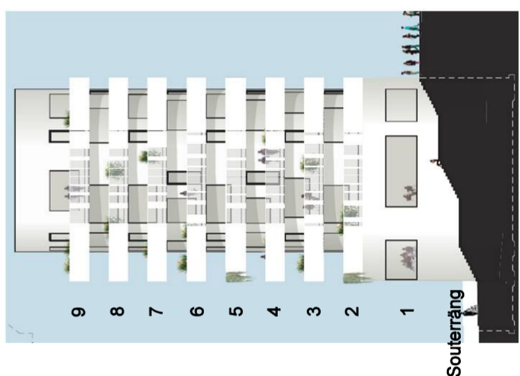
Sektion, vy mot väster, ej skalernig.