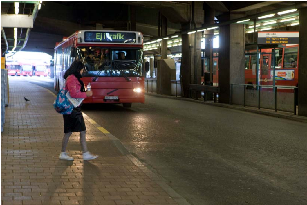
Bussterminalen idag. Passagerare och bussar i blandtrafik med väntytor för resenärer utomhus på kajplan under den ovanliggande tunnelbanan och Katarinavägen.