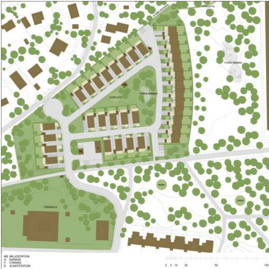
Illustrationsplan, 34 nya småhus, Ettelva Arkitekter