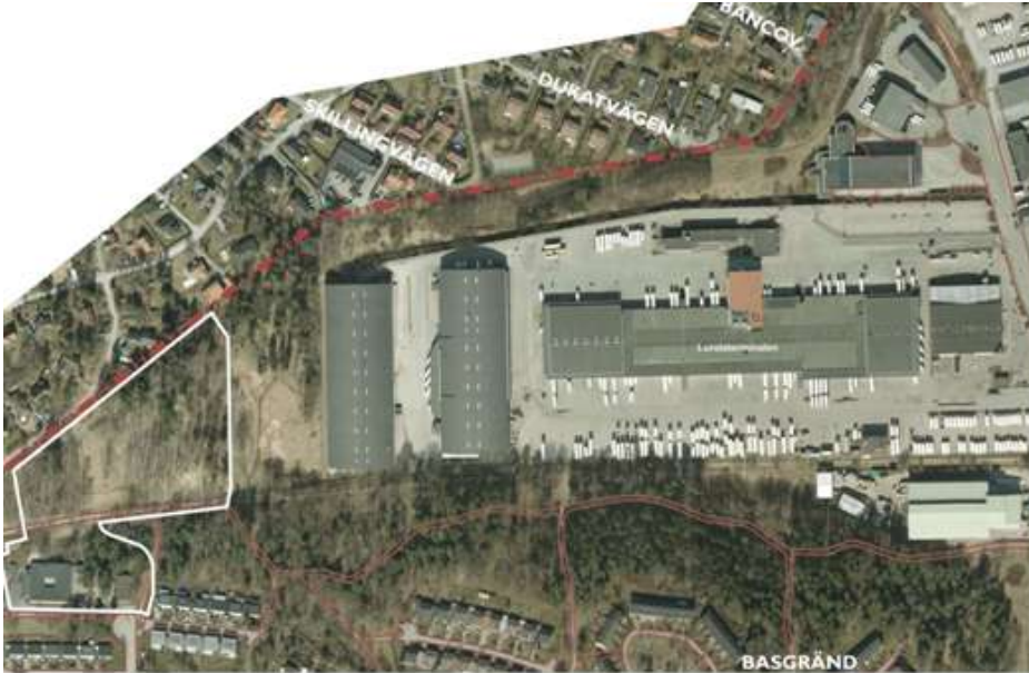
Lundaterminalen samt adresser där störningar tidigare har rapporterats