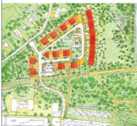
Utställning (34 småhus)

Stadsbyggnadsnämnden beslutade den 17 oktober 2007 att återremittera kontorets redovisning av plansamrådet, med anledning av att stadens arbete med "Riktlinjer för företagsområden" först skulle färdigställas. Dessa riktlinjer antogs sedan av kommunfullmäktige i mars 2008. Den 11 september 2008 godkände stadsbyggnadsnämnden redovisningen av plansamrådet samt uppdrog åt kontoret att ställa ut planförslaget med den förändringen att en sammankoppling till Banvägen i Järfälla redovisas. Vidare reviderades förslaget utifrån utförd riskanalys.