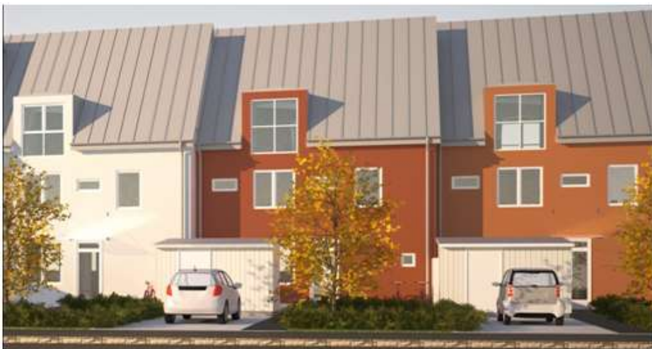
Radhusen från väster/gatusida samt exempel på tänkt färgsättning, Ettelva Arkitekter