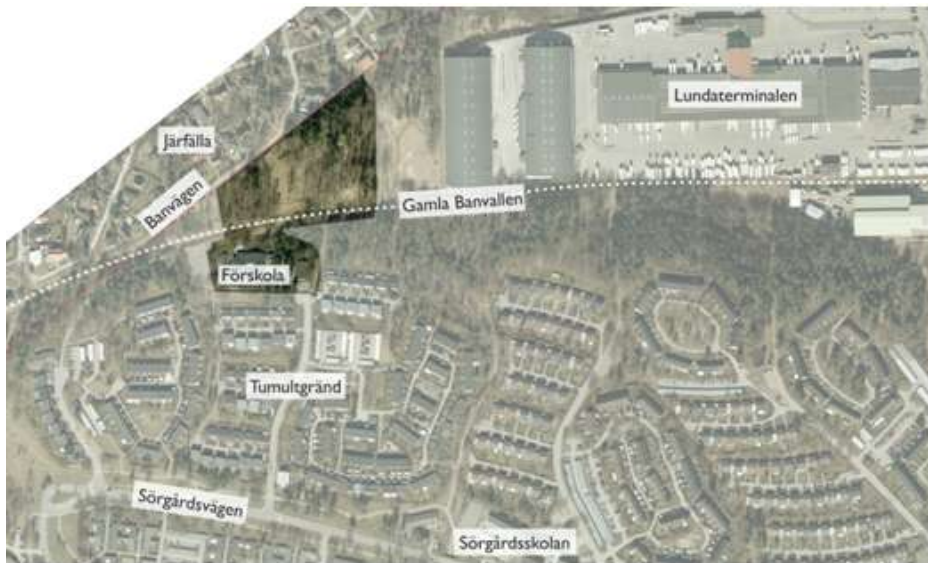
Planområdet med omgivning