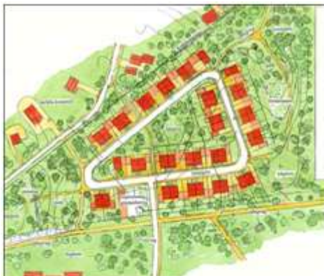
Programsamråd (41 småhus)