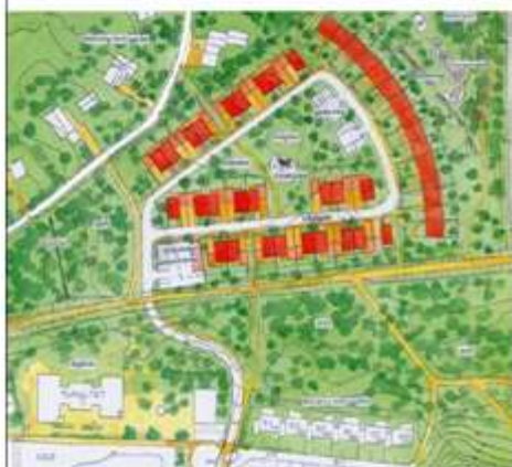
Plansamråd (41 småhus)