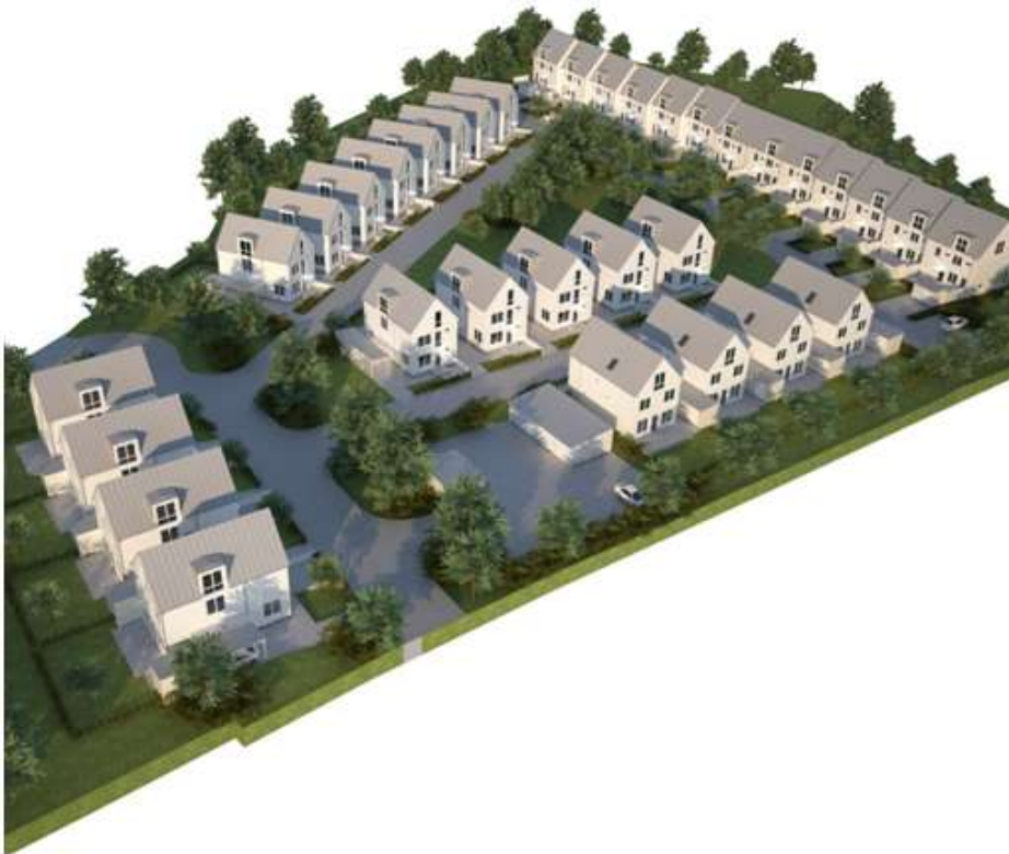
Volymstudie från söder. OBS! Illustration visar ej huskulör, Ettelva Arkitekter