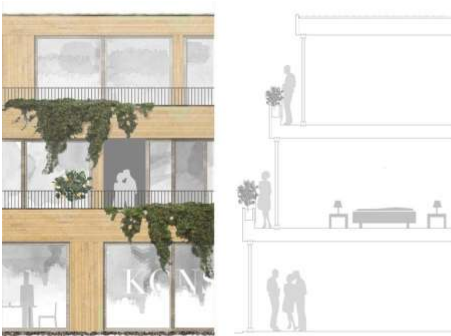
Fasadutsnitt och sektion av terrasser