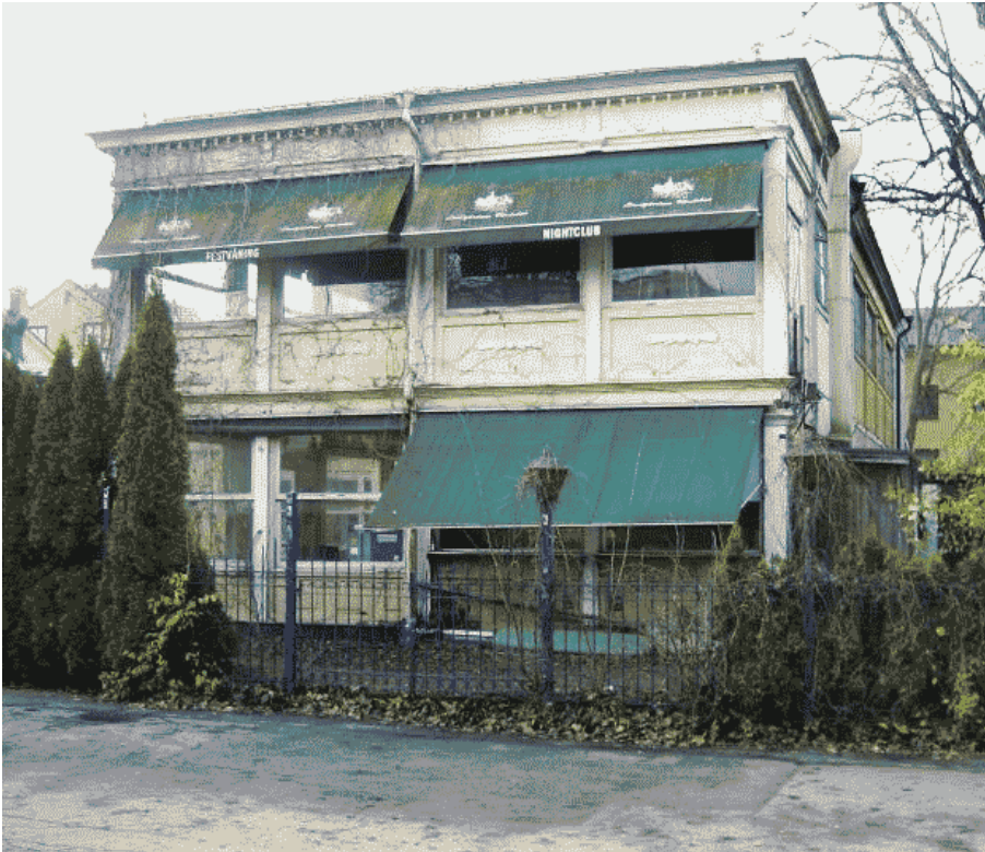
Nuvarande Restaurang Lindgården