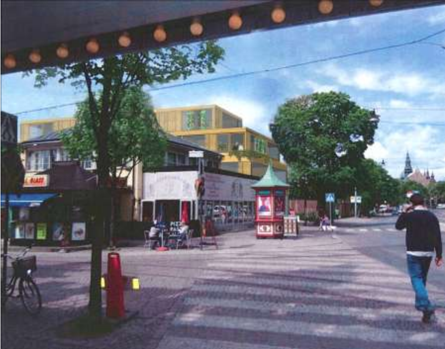
Vy över det nya hotellet från Djurgårdsvägen i söder. Illustration: Johan Celsing Arkitektkontor