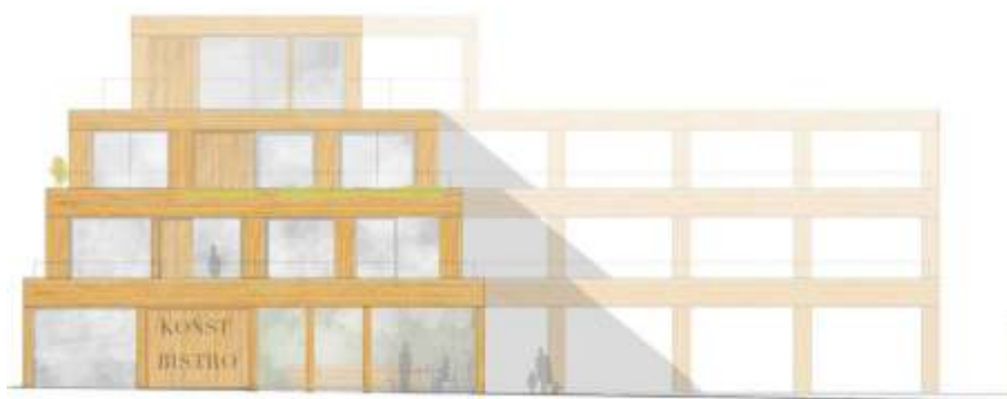
Fasad mot Djurgårdsvägen