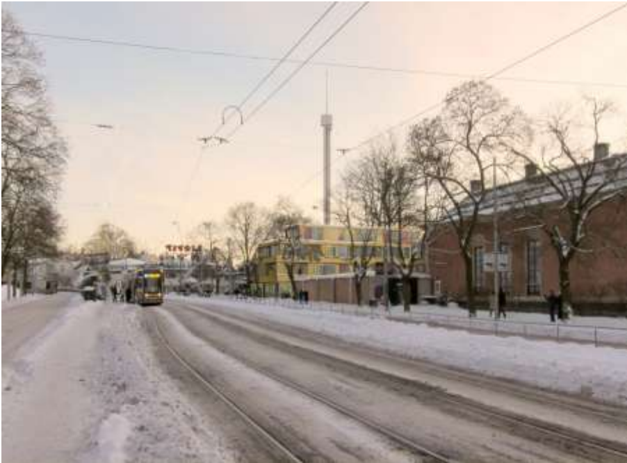
Vy över det nya hotellet från Djurgårdsvägen i norr. Illustration: Johan Celsing Arkitektkontor