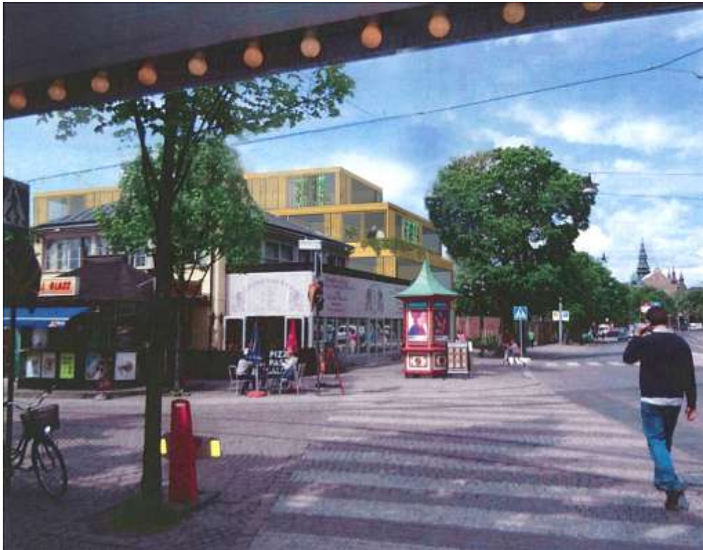
Vy över det nya hotellet från Djurgårdsvägen i söder. Illustration: Johan Celsing Arkitektkontor