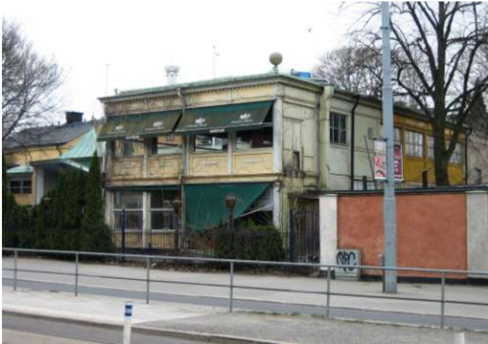
Den befintliga byggnaden på Konsthallen 2 där Restaurang Lindgården tidigare huserade har stått oanvänd sedan 1993 och är numera förfallen.