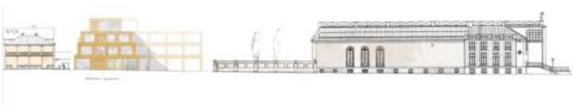
Elevation mot Djurgårdsvägen. Illustration: Johan Celsing Ark.

Entré sker över gården från Djurgårdsvägen. Gården utformas med hällar av natursten och med plats för ett eller ett fåtal träd. Integrerat med gårdsgestaltningen finns möjlighet att placera låga lanterniner för överljus till utställningslokaler i källarvåningen. Kring gården ligger hotellets publika lokaler med bar och restaurang, reception samt lokaler för utställningar och konferenser. En mindre urtagning i huset görs mot Konsthallen 14 i väster för att bevara befintliga uppvuxna träd och skapa distans till bostadshuset. I den del av gården som ligger närmast Blå Porten placeras en garagedfart. Nedfarten integreras i gårdsgestaltningen men avgränsas med en lägre mur eller bänk mot vistelseytorna.