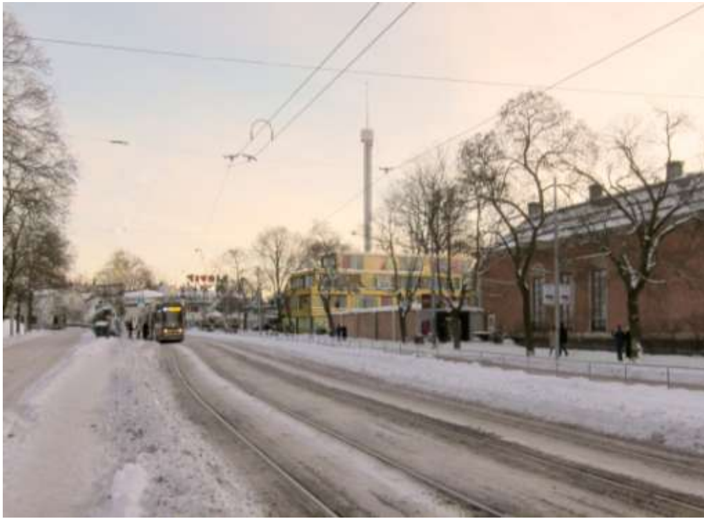
Vy över det nya hotellet från Djurgårdsvägen i norr. Illustration: Johan Celsing Arkitektkontor