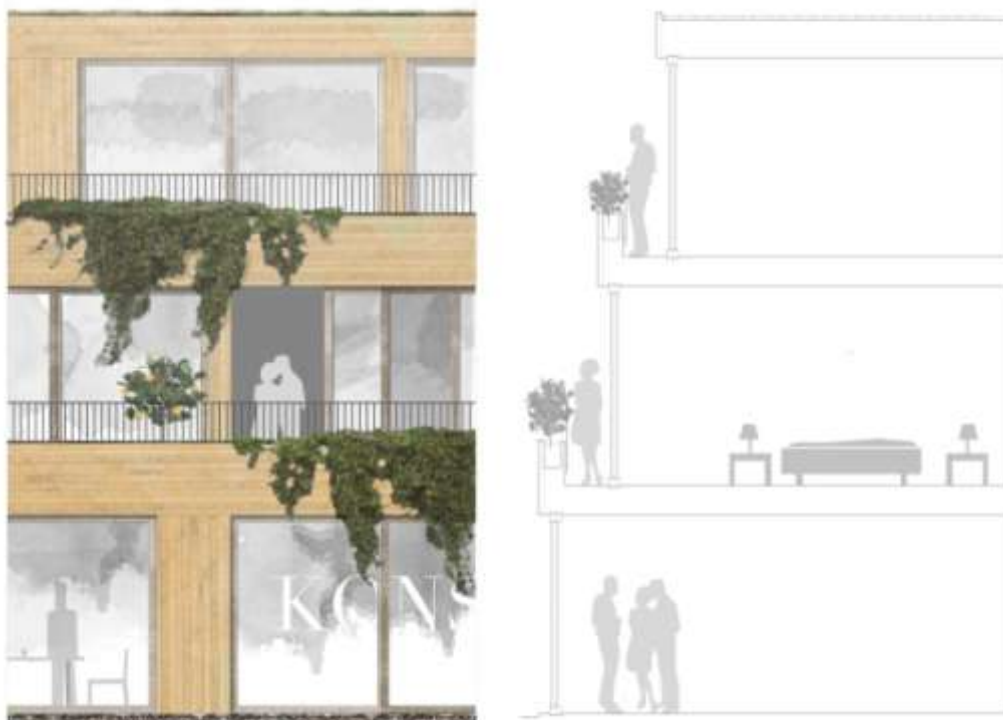
Fasadutsnitt och sektion av terrasser. Illustration: Johan Celsing Ark.