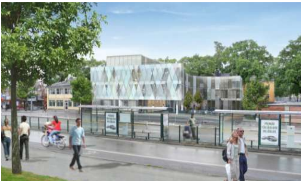
Tidigare förslag till detaljplan för kv. Konsthallen 2. Beslut om antagande av planförslaget har upphävts av länsstyrelsen. Illustration: SandellSandberg Arkitektkontor

Detaljplanen innebar ett nytt hotell i fyra våningar om ca 3250 kvm BTA. Huset föreslogs få en modern utformning med skulpturala former och fasader i färgat och klart glas.