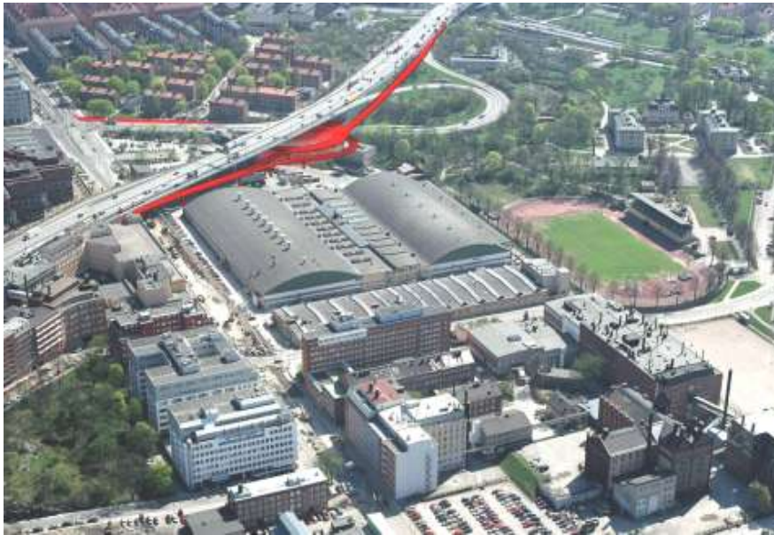
Flygbild mot sydost där förslaget är markerat med rött (fotomontage: & Rundquist arkitekter

Dagens trafikplats har inga trafiktekniska brister förutom att påfartsrampen söderut har en för kort påfartsträcka jämfört med dagens normer. Trafikmängden på Essingeleden förväntas att öka i framtiden. Detta kommer att medföra ytterligare kapacitetsproblem på leden. Vid ett bevarande av nuvarande trafikapparat kommer kapacitetsproblem att uppstå under förmiddagens maxtimme med köbildning bakåt på Essingeledens ramper. Förslaget alternativt innebär förbättrad kapacitet i trafikplatsen. Enligt kontorets bedömning kommer risken för upphinnandeolyckor att minska på Essingeleden då framkomligheten med den nya trafikplatsen blir bättre än dagens.