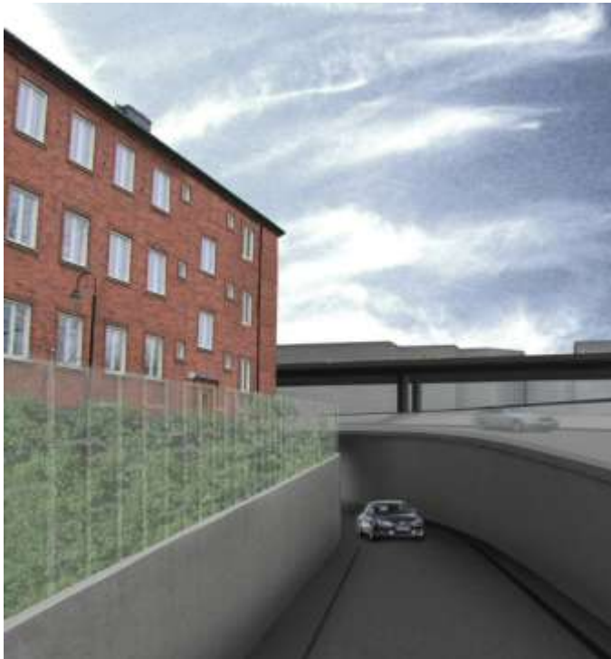
Befintligt bostadshus och föreslagen direktram (fotomontage: &Rundquist arkitekter)

Stadsbyggnadskontoret har gjort bedömningen att huset på Alsiskan 1 inte är lämpligt för bostadsändamål och fastighetens användning i detaljplanen ändras därför från bostäder till kontor.