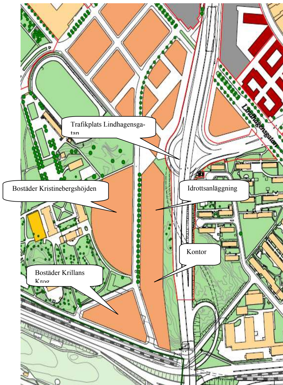
Utdrag ur stadsbyggnadskontorets översiktskarta över stadsutvecklingsområdet Västra Kungsholmen

Markanvisning har skett till Svenska Bostäder och NCC för uppförande av bostadsbebyggelse på Kristinebergshöjden. NCC har även fått markanvisning för uppfö-