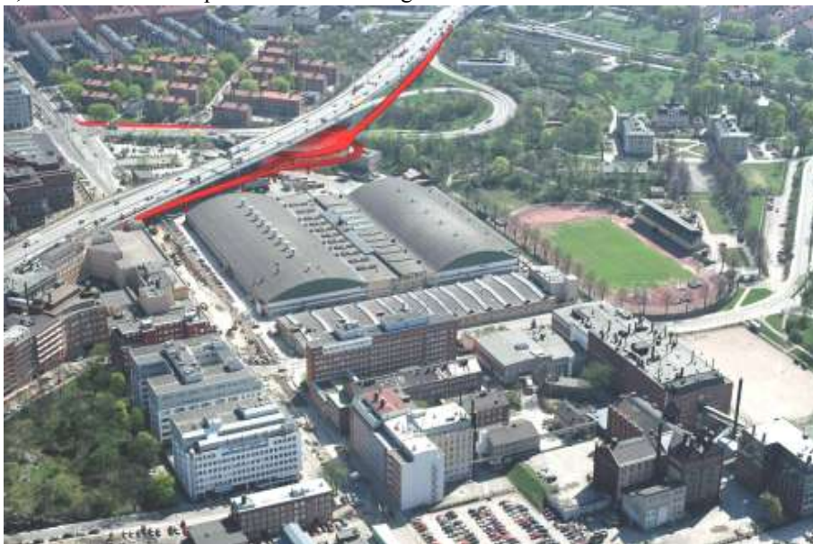
Flygbild mot sydost där förslaget visas med rött (fotomontage: &Rundquist arkitekter)

Planförslaget innebär att den nuvarande trafikplatsen ersätts med en mindre trafikplats, vilken i huvudsak placeras under Essingeledens bro.