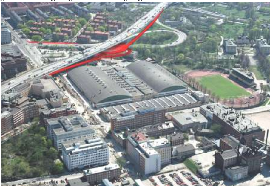
Flygbild mot sydost där förslaget är markerat med rött (fotomontage: &Rundquist arkitekter)

Trafikplats Lindhagensgatan planeras att byggas om till en mindre ytkrävande anläggning. Den föreslagna trafikplatsens på- och avfartsramper blir parallella med Essingeleden och ansluts till en droppformad trafiklösning (en s.k. ”droppe”) under Essingeleden. Befintliga av- och påfartsramper på Kristinebergshöjden rivs. Utanför avfartsrampen från norr föreslås en avfartsramp som inte ansluts till ”droppen”. Denna ”direktramp” passerar planskilt under ramperna på trafikplatsens södra sida. Genom direktrampen minskar konflikterna mellan höger och vänstersvägande trafik i korsningen mellan Kellgrensgatan och Lindhagensgatan.