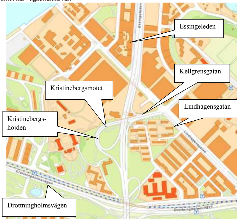
Kristinebergsmotets läge i Stockholm

Kristinebergsmotet tillhör Essingeleden (E4/E20) som är en statlig väg där Trafikverket har väghållaransvar.