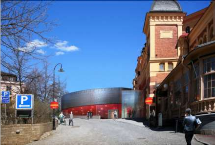
Perspektiv, från Hazeliusbacken med nya scenhuset i fonden och entrélänk till vänster om Cirkus.

Det föreslagna scenhuset och en ny förbindelselänk mellan scenhus och entré placeras i anslutning till nordvästra delen av Cirkus. Någon alternativ placering bedöms inte vara realistisk på grund av brist på utrymme samt nödvändigheten att den nya entrén sammanlänkar både Cirkus och det nya scenhuset. Scenhusets placering och entrén bygger vidare på Cirkus historiska entréplats och gör det även möjligt att dubbelutnyttja befintliga loger, förråd och inlastning i cirkusbyggnaden. På så sätt kan tillbyggnadens storlek begränsas vilket utrymmena under jord även syftar till. Scenhuset är förutom den lätta glasade förbindelselänken frikopplad från cirkusbyggnaden. Scenhuset och förbindelselänken utformas med respekt för huvudbyggnadens arkitektur. Det ska tydligt gå att avläsa byggnadsminnet.