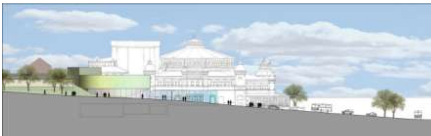
Scenhuset från Hazeliusbacken innan sänkning med ytterligare några decimeter.

Önskemål har inkommit om en ytterligare reducering av tillbyggnadens höjd. Stadsbyggnadskontoret har under hela planprocessen sökt hålla nere takhöjden och scenhusets utbredning mot Hazeliusbacken. Scenhusets höjd minskades med 30 cm inför utställningen medan byggnaden drogs tillbaka ca 0,85 meter från Hazeliusbacken. Det är klart uttryckt från byggherrens sida efter Länsstyrelsens utställningsyttrande, att ytterligare reduktion av scenhuset inte gör projektet genomförbart. Företrädaren för byggherren anför i ett brev 2011-05-03 att "Konsekvensen av indragningen (om 0,85 meter) är, att antalet sittplatser minskat med drygt ett 30-tal till 670 platser, vilket i sig är betydligt under det antal platser som vi kalkylerat med tidigare, som ett minimalantal ur ekonomiskt perspektiv". Erfarenheter från planprocessen gör att kontoret har svårt att ifrågasätta synpunkterna att en ytterligare reducering av tillbyggnadens höjd och indragning från gatan skulle äventyra hela projektet.