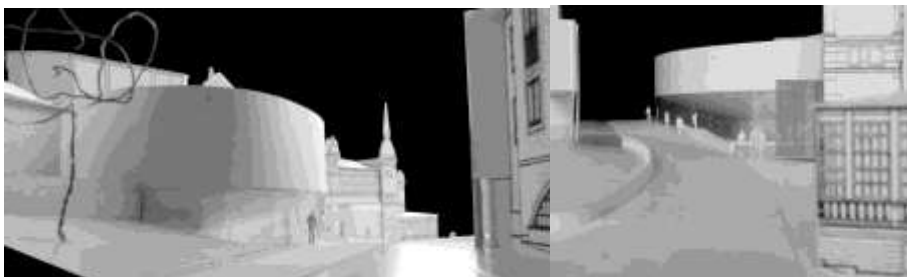
Modell över nytt scenhus med länk, vy från norr

Hazeliusbackens historiska sträckning påverkas inte av tillbyggnadens placering. Ambitionen har varit att hålla nere höjden på scenhuset för att Skansenberget som fond ska fortsätta att råda. Den rundade fasaden av zink alt bearbetad rostfritt stål och glas bidrar till att sträckan, där gaturummet smalnar av, förkortas.