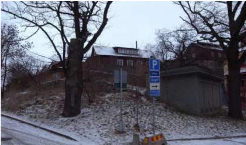
Two of the oaks at Hazeliusbacken and the station next to the parking area