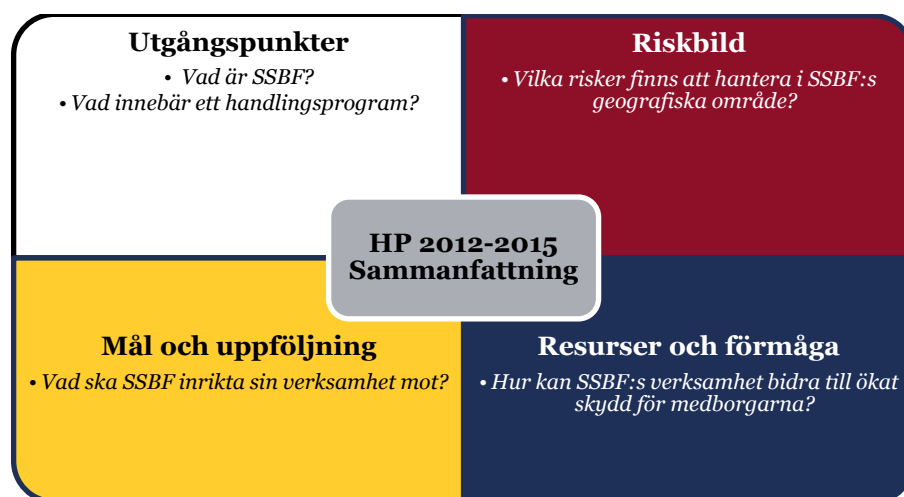
Figur 1 Illustration över handlingsprogrammets upplägg.

Detta dokument utgör en del av den dokumentsamling som tillsammans utgör Storstockholms brandförsvars (SSBF) handlingsprogram för åren 2012-2015. Handlingsprogrammet omfattar SSBF:s hela verksamhetsområde och är utformat i enlighet med Lag (2003:778) om skydd mot olyckor (LSO).