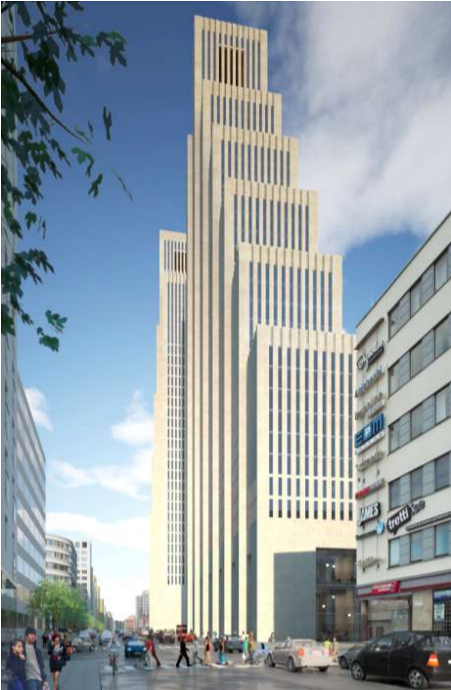
Tors torn från Norra Stationsgatan