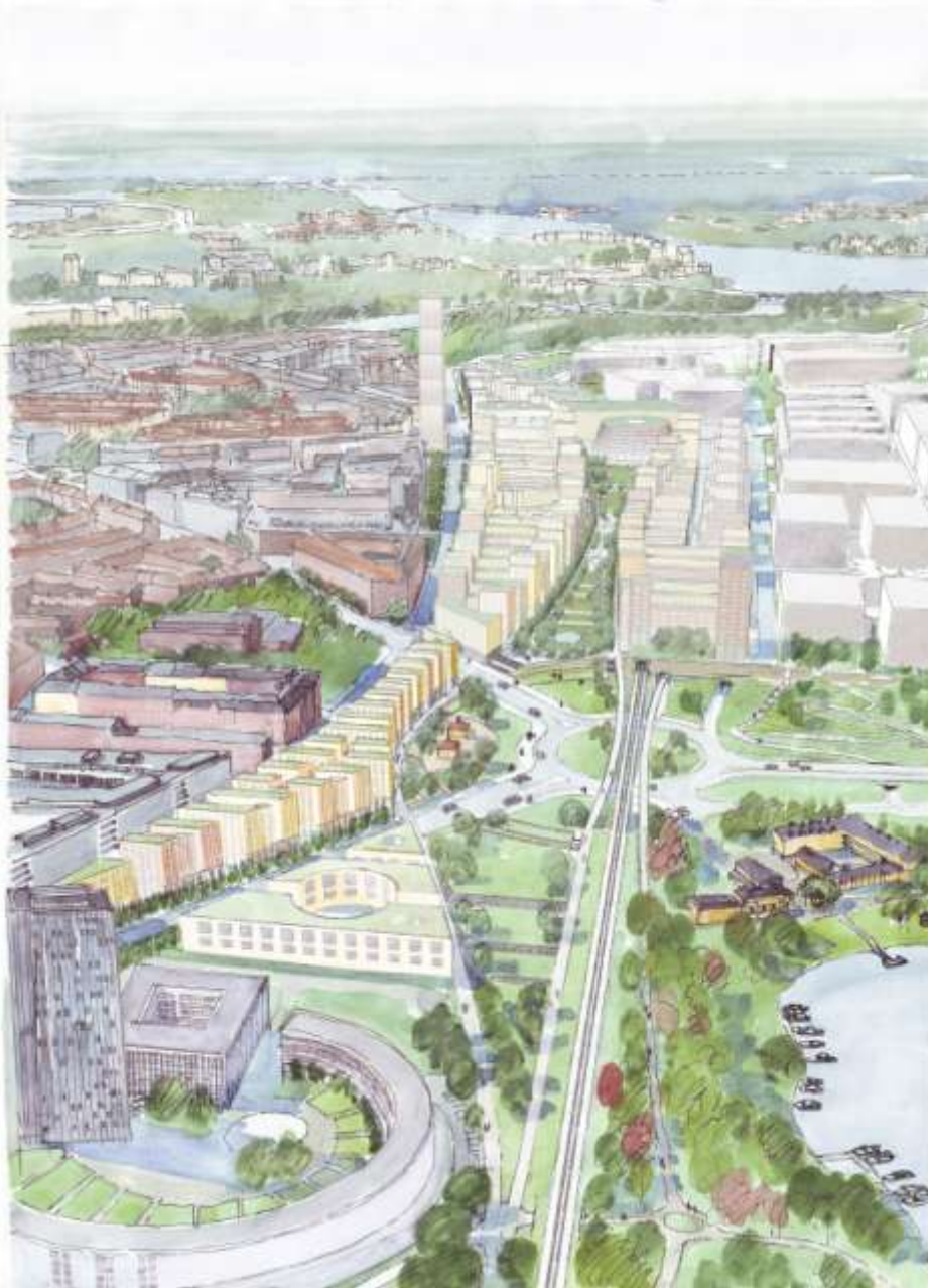
Vasastaden utvidgas över stationsområdet och förenas med Hagaparken