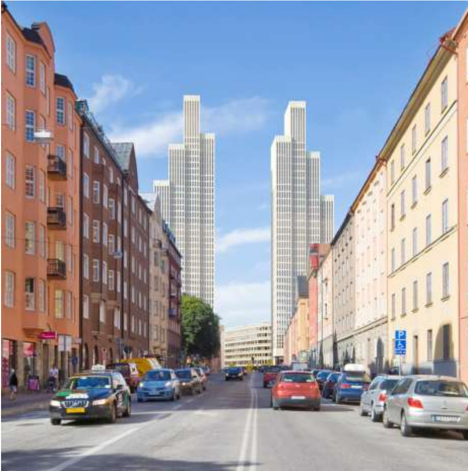
Tors torn sedda från Torsgatan