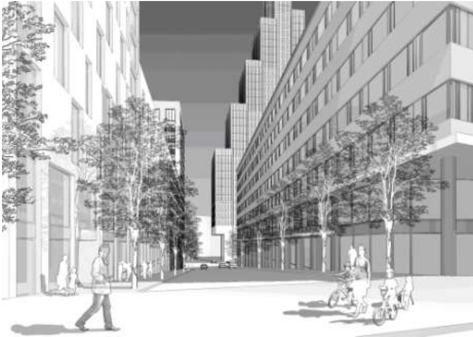
Gävlegatan mot söder

Förhållandet till Röda bergsområdets karaktäristiska och småskaliga bebyggelse har tagits i beaktande. Röda bergsområdets symmetriska och harmoniska komposition med tre sammanstrålande gator förenas med Norra Stationsområdet genom tornparet som fondmotiv både mot norr och söder. Genom både kontrastverkan och samspel uppstår en sammanhängande stadsensemble där två stadsbyggnadsepoker möts. Stadsbyggnadskontoret gör bedömningen att tornen inte kommer att påverka befintlig bebyggelse i Röda bergen negativt. Den nya bebyggelsen placeras norr om Vasastaden vilket innebär marginell påverkan beträffande sol- och ljusförhållanden på befintlig bebyggelse.