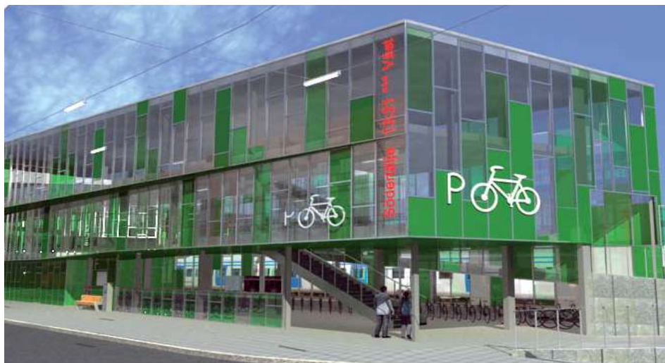
Resecentrum och cykel-p-huset

upprustade samt klimatiserade kommunikationsytor (f1+f2) , det s.k. resecentrumet. I anslutning till kommunikationsytorna uppför SL en väntsal för bussresenärer (e2). För att lösa cykelparkering föreslås ett cykel-p-hus (l) i flera plan direkt anslutet till resecentrum. Cykel-p-hus i flera plan