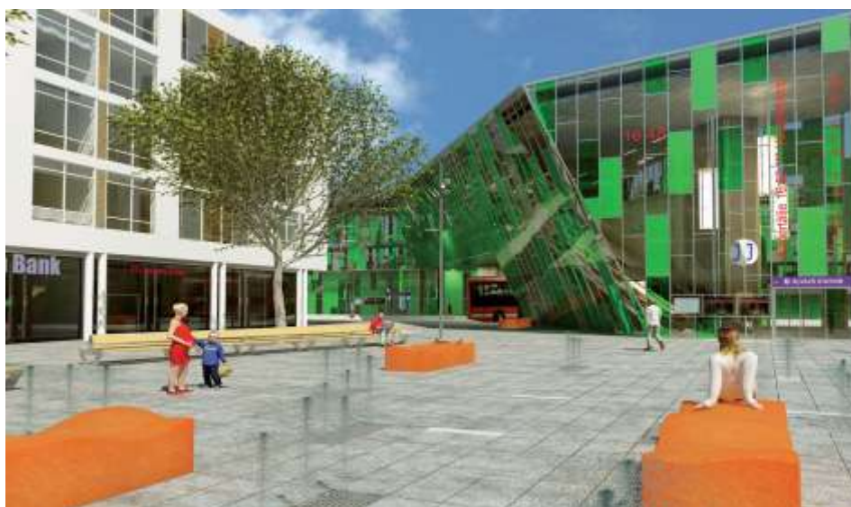
Resecentrum vid torget

Befintlig infartsparkering vid Herr Stens väg/Älvsjövägen (kv 6) har utökats genom att befintliga tennisbanor avvecklats.