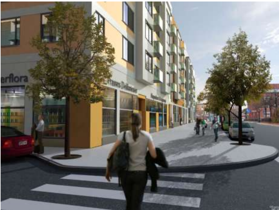
Gatuperspektiv. Illustration Brunnberg och Forshed arkitektkontor AB