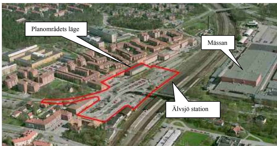
Planområdets läge i Älvsjö

Älvsjö är en viktig trafikknutpunkt. Stationen är en av de mest trafikerade järnvägsstationerna i landet. Bussterminalen trafikeras av ett flertal linjer med vilka större delen av Söderort nås.