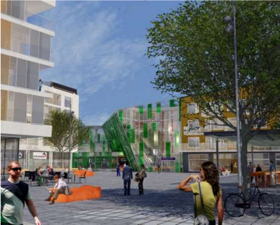
Älvsjö torg. Illustration Ramböll