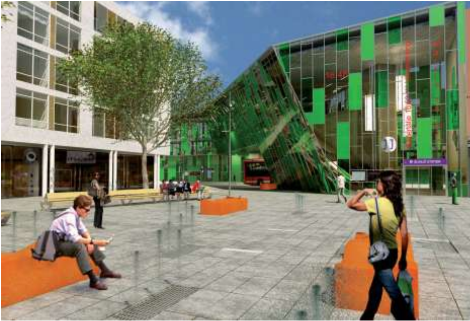
Resecentrumets entrébyggnad sedd från torget. Illustration av Ramböll

Mellan torget och bussgatan lokaliseras resecentrums entrébyggnad. Entrébyggnaden integrerar torget med stationen och utgör en tydlig målpunkt för kollektivtrafikresenärerna.