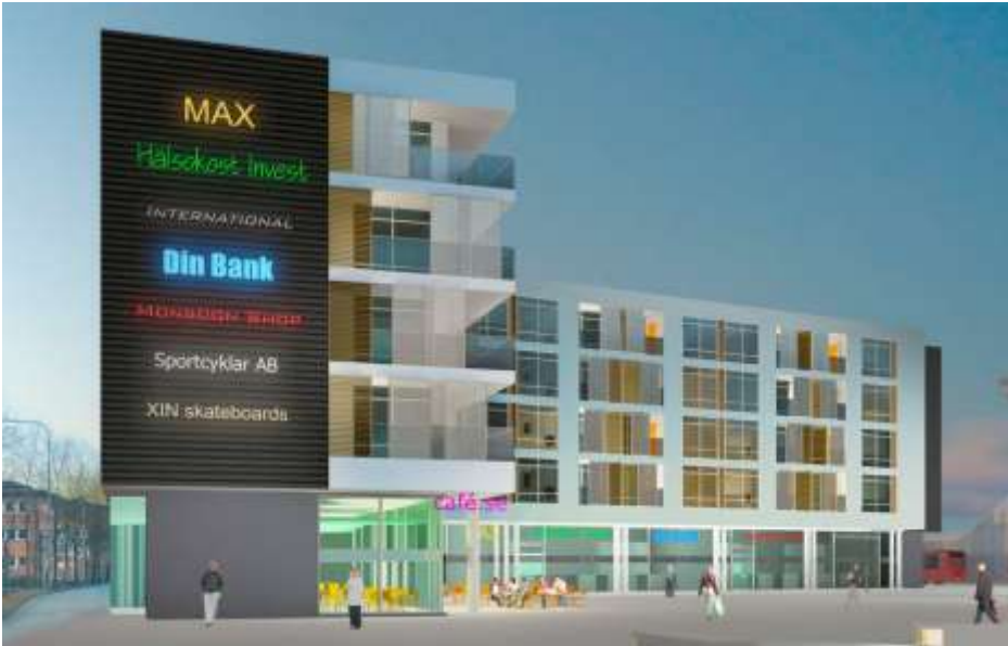
Kvarter 2 sett från torget. Illustration Brunnberg och Forshed arkitektkontor AB