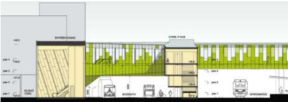
Sektion genom resecentrumet med Älvsjö torg till vänster och spårområdet till höger i bild. Illustration av KHR Rundquist Arkitekter.

Mellan torget och bussgatan lokaliseras resecentrums entrébyggnad. Entrébyggnaden integrerar torget med stationen och utgör en tydlig målpunkt för kollektivtrafikresenärerna.