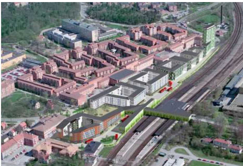
Föreslagen bebyggelse sedd från sydväst. Denna detaljplan behandlar de tre första kvarteren, torget och resecentret. Illustration av KHR Rundquist Arkitekter.

För området intill Älvsjö pendelstation föreslås fem nya byggnadskvarter, ett nytt torg och ett resecentrum. Förslaget innebär en kvartersstruktur, en tät stadsmiljö, kvarteren är fem till sex våningar höga och i områdets östra del medges en fjorton våningar hög accentbyggnad. Lokaler planeras i kvarterens bottenvåningar. Detaljplanen behandlar de tre första kvarteren samt torget och resecentret.