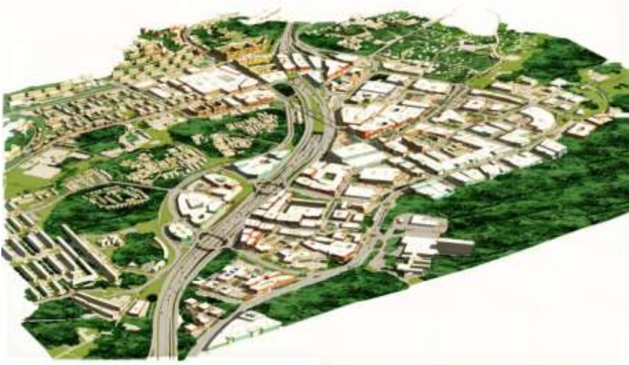
Illustration Kungens kurva - Skärholmen