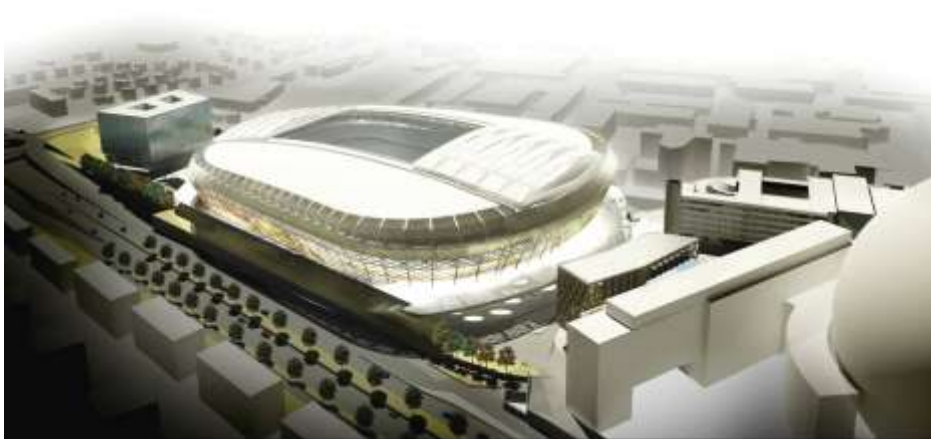
Illustration över Stockholmsarenan mm från nordöst

Stockholmsarenan föreslås byggas strax söder om Globen, mellan Nynäsvägen och Arenavägen. Norr och söder om arenan föreslås nya torg. Mot det norra torget föreslås Quality Hotel Globe byggas till med en ny byggnadskropp. Arenatorget förlängs över det norra torget så att det ansluter till arenans huvudentréplan. Under förlängningen av torget skapas nya kommersiella ytor som kopplas till Globen Shopping. Söder om det södra torget föreslås ett nytt kontorskvarter med publika funktioner i bottenvåningen. Arenans huvudentréplan kopplas till torget med två breda trappor. Runt arenan föreslås en distributionsgata (Arenaslingan). Mellan arenan och Nynäsvägen bevaras den befintliga gång- och cykelvägen, dock i ett något flyttat läge. Arenans västra sida vetter mot och hänger delvis ut över Arenavägen. Här samordnas entréer med publika och kommersiella funktioner.