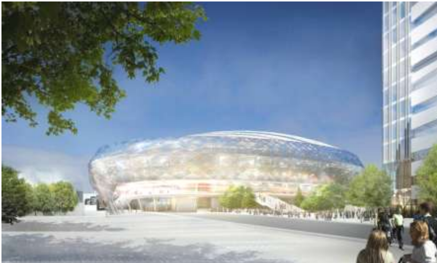
Illustration över Stockholmsarenan från söder. Det föreslagna kontorskvarteret skymtar till höger.

Arenan föreslås få ett skjutbart tak för att möjliggöra evenemang året runt. Med hjälp av installationer för uppvärmning kan arenan få ett behagligt klimat även vintertid. Med en utformning som möjliggör att evenemang blir oberoende av årstider och väderlek ökar möjligheterna att bredda utbudet, jämfört med om arenan byggs med ett traditionellt tak (som är öppet över spelplanen) och utan uppvärmningsmöjligheter.