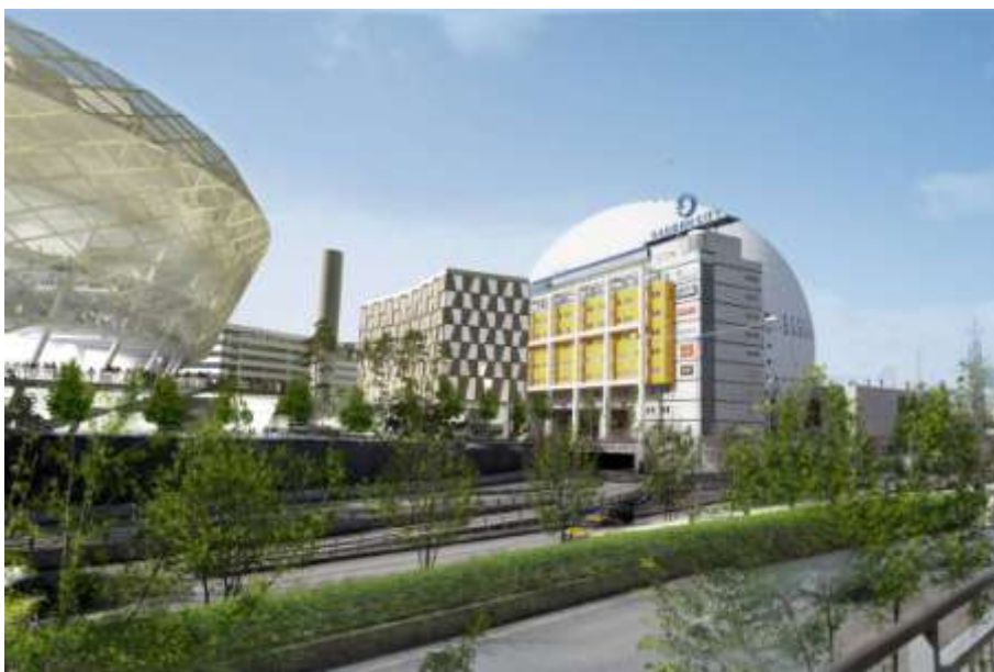
Illustration över den föreslagna tillbyggnaden av Quality Hotel Globe från Nynäsvägen.

ny byggnadskropp. Den nya byggnaden föreslås utformas som en något vinklad lamell parallell med det befintliga hotellet. Tillbyggnaden föreslås bli 9 våningar hög, 1 våning lägre än befintligt hotell, och rymma ca 180 nya rum. För att synliggöra det befintliga hotellets karakteristiska utvändiga pelarstomme och kulörta färgsättning koncentreras tillbyggnaden till det befintliga hotellets mittdel. Det två hotellflyglarna kopplas med en transparent länkbyggnad som bland annat kan rymma en ny gemensam reception och foajéytor.