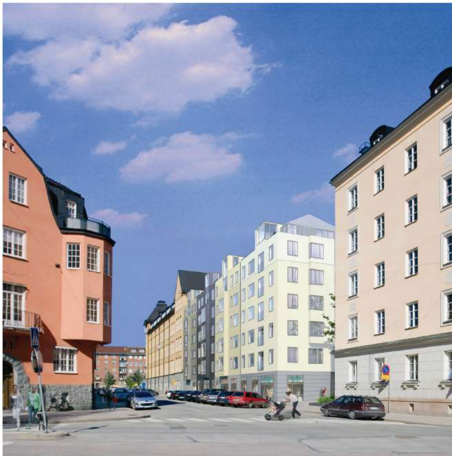
Perspektiv från Östermalmsgatan mot Uggelviksgatan. Fotomontage: Reflex Arkitekter

gaturum och mer av Lärkstadens lekfullhet. Avsikten är att de föreslagna husen vid Danderydsgatan respektive Uggelviksgatan på bästa sätt ska vara i samklang med omgivande miljö och bli ett tillskott i helheten. Utformningen och gestaltningen av bostadshusen redovisas i illustrationsbilagan, som tillhör planhandlingarna. Planbestämmelserna anger att redovisade illustrationer i princip ska följas.