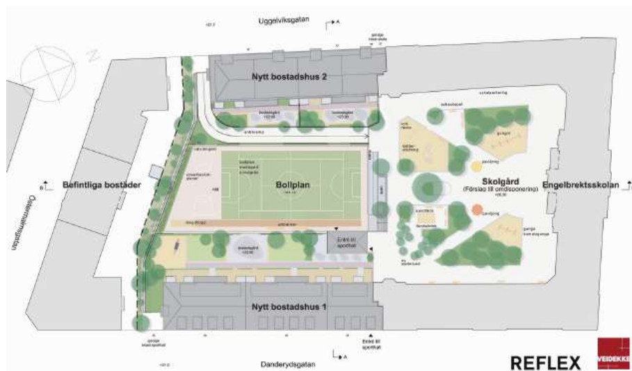
Illustrationsplan över planområdet.

idrottshallen under skoltid nyttjas av skolan och under övrig tid av klubbar och allmänhet. Sporthallen markerar sig främst mot grannfastigheterna i söder i form av en granit klädd mur med växtlighet.