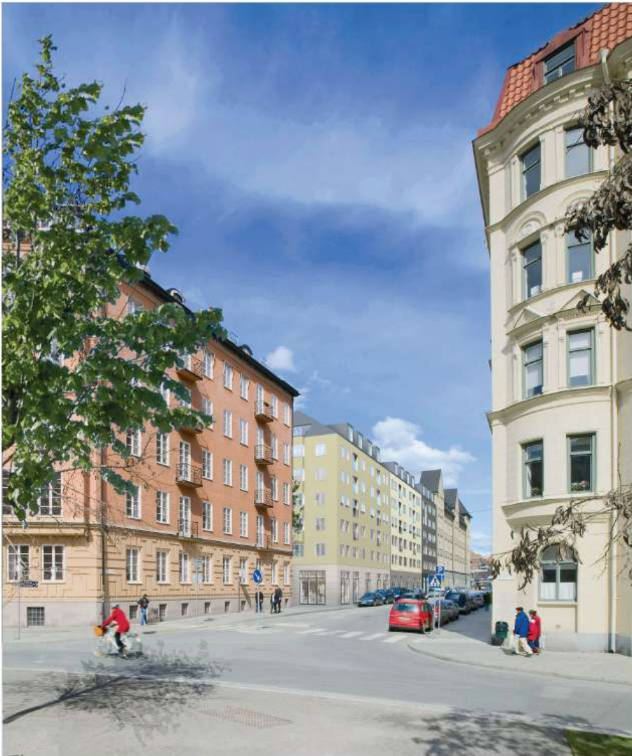
Perspektiv från Östermalmsgatan mot Danderydsgatan. Fotomontage: Reflex Arkitekter

Vid gestaltningen av de föreslagna bostadshusen har intryck tagits av den befintliga bebyggelsen kring Danderydsgatan, Uggelviksgatan samt dess omnejd. Området präglas av olika stilhistoriska uttryck från klassicism och nationalromantik från 1880-tal till nyklassicism på 1920-tal. Bebyggelsen hålls dock ihop av flera gemensamma drag men gatorna skiljer sig i uppbyggnad, uttryck och skala. Danderydsgatan har ett mer sammanhållet gaturum och en för Stockholm mer karakteristisk stenstadsarkitektur, både i skala och utseende. Uggelviksgatan har ett mer småskaligt och variationsrikt