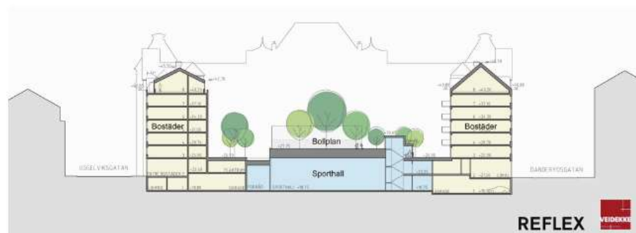
Sektion mellan Uggelviksgatan och Danderydsgatan där sporthallen läge redovisas.