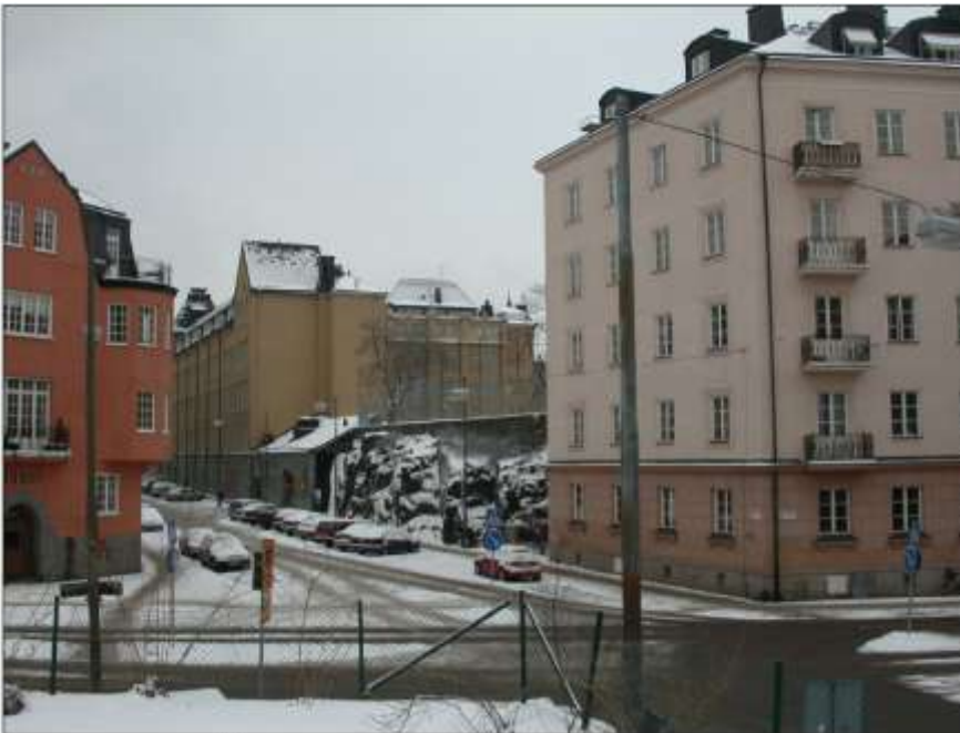
Uggelviksgatan från Östermalmsgatan idag.