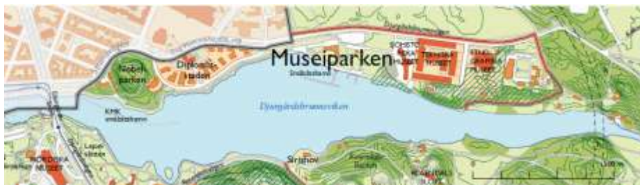
Östermalm 1:20, inom den bebyggda och anlagda delen Museiparken, Kungliga nationalstadsparken.

Statens fastighetsverk har ansökt om en planändring för att göra om lokalerna i Gamla Skogsinstitutet till ett ambassadkansli, i första hand åt Israel. Bebyggelsen har tidigare använts av Livrustkammaren. Gamla Skogsinstitutet är klassat som statligt byggnadsminne och Nobelparken ligger i Kungliga nationalstadsparken. Länsstyrelsen anser att planförslaget är förenligt med nationalstadsparkens syfte och att stor omsorg måste läggas på att utformning och placering av fordons hinder. Planförslaget har mött starkt motstånd hos sakägare, boende och intresseföreningar. UD och polisen anser att detta är en bra lokalisering. Kontoret har till utställningen upprättat ett kvalitetsprogram som tillförts planen och som illustrerar fordonshindrens utformning och deras placering.