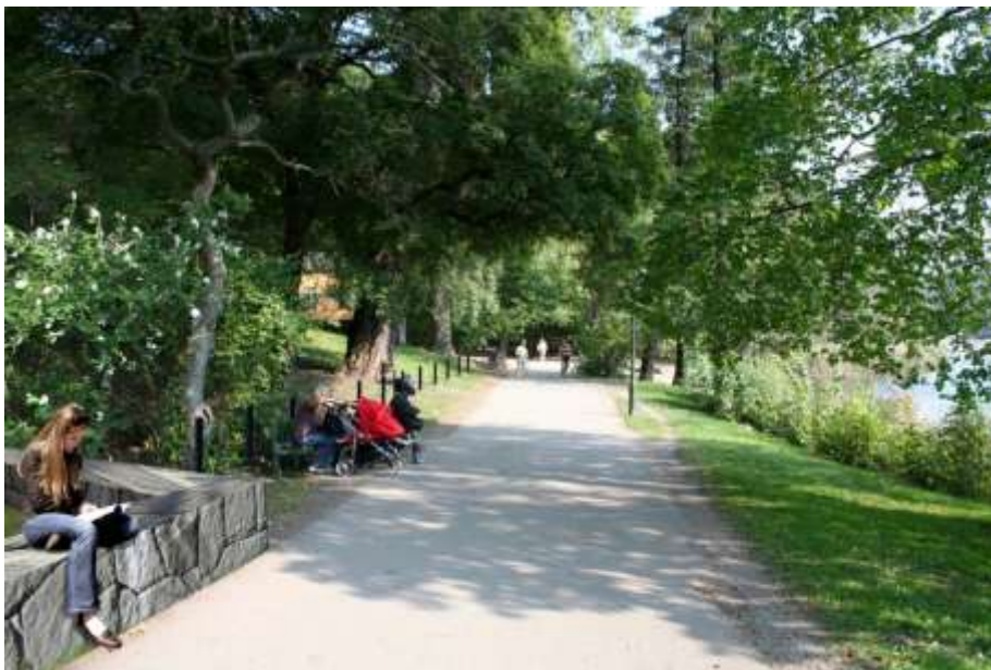
Gångvägen utmed Djurgårdsbrunnsviken med murar och pollare på vänster sida.

fordonshinder, placering regleras på detaljplanens plankarta.