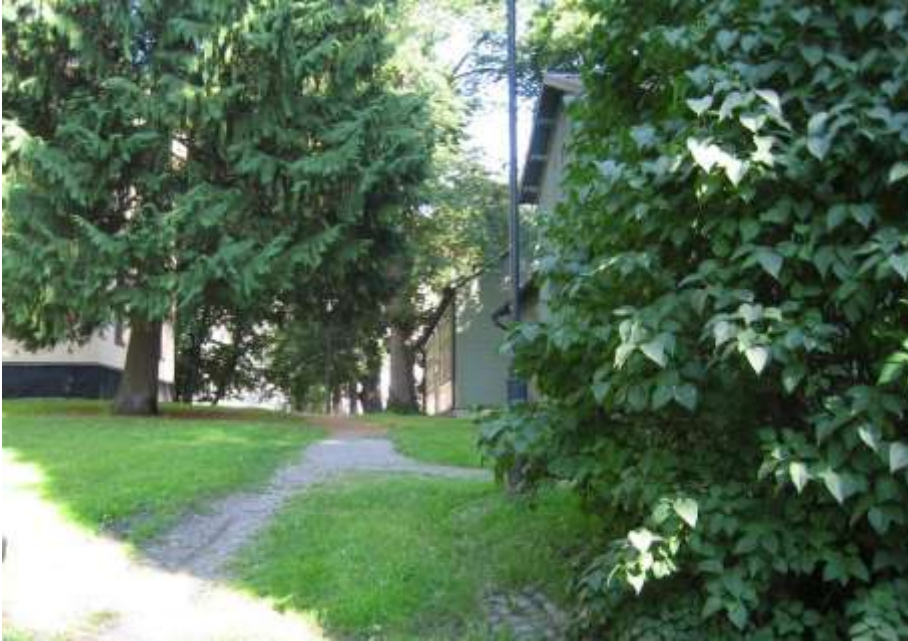
Den branta gångvägen ned mot Djurgårdsbrunnsviken