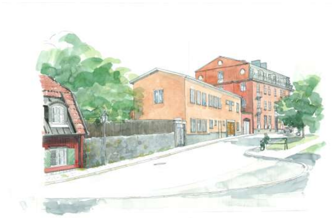
Förslag på utformning av förskolan längs Stigbergsgatan, österut. (Owe Lindh Arkitekter)

Förslaget innebär att parkmark förs över till kvartersmark och att en byggrätt medges för en förskola i två plan, om totalt ca 600 m 2 , som rymmer tre förskoleavdelningar. Byggnaden anpassas till den kringliggande bebyggelsen. Förskolan placeras med fasad i liv med gatan och befintlig mur tas här bort. Resterande mur med plank utmed Stigbergsgatan och muren utmed planområdets östra sida bevaras och ingår i kvartersmarken samt kulturskyddas. På detta sätt bevaras Stigbergsgatans karaktär med ett slutet gaturum på sin norra sida. Lekutrustning placeras på förskolans gård som också kringboende barn har tillgång till då förskolan är öppen.