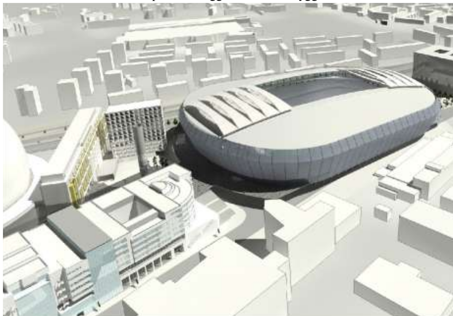
Illustration av White

En av Stockholm stad godkänd sakkunnig i tillgänglighetsfrågor, har upprättat ett tillgänglighetsprogram som ligger till grund för den fortsatta projekteringen. Detta arbete sker i samarbete med planhandläggare från stadsbyggnadskontoret.