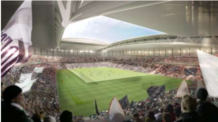
Arenarummet. Illustration av White

Publikkapaciteten blir 30 000 vid fotbollsmatcher och drygt 40 000 vid konserter. Åskådaranantalet fördelas i två etage, med 15 000 platser på vardera. Arenan är planerad att invigas i slutet av 2012 och ska därefter stå värd för en mängd evenemang. Till exempel allsvensk och internationell fotboll, konserter, inomhusfriidrott, mässor, företagsmöten samt is-, häst- och motorsport.