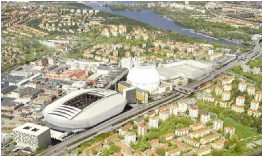
Situationsplan. Illustration av White

Andra motiv är bland annat att området redan i dag är ett väl fungerande och etablerat evenemangsområde, omgivet av goda vägförbindelser och kollektiv-trafik. Området har sju tunnelbanestationer inom radien av en kilometer, till detta kommer tvärbane-förbindelser och ett stort antal bussförbindelser, främst till Gullmarsplan. Ur ett hållbarhetsperspektiv är denna placering mycket god, då arenan placeras i en befintlig infrastruktur.