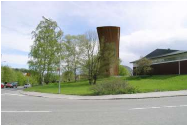
Avluftstorn vid Ryttsstadion, till höger syns gaveln på "röda ridhuset".

strider mot ett flertal miljömål, bl.a "frisk luft" och "begränsad klimatpåverkan". Det går inte att innehålla de bullergränser som gäller för områden för rörligt friluftsliv. Det är tekniskt möjligt att placera ventilationstornen på andra platser genom att bygga kulvertar. Tornen kan göras lägre. Stockholms brandförsvär anser att avluftningstornets höjd har inverkan på spridningsbilden i händelse av brand eller utsläpp av giftig gas.