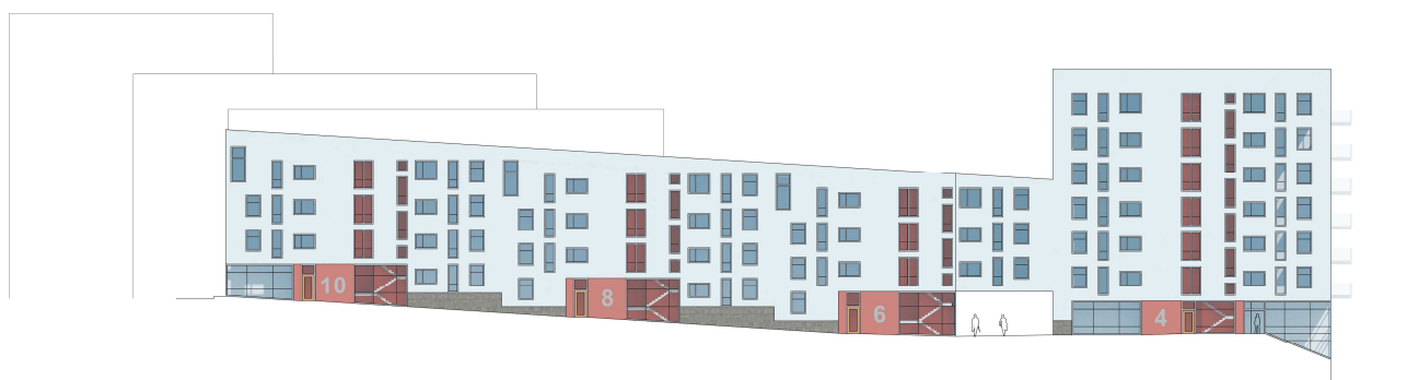
Fasader mot Bällstavägen

Fasader utförs i material med slät yta, förslagsvis puts eller skivmaterial i genomfärgad minerit, och hörnen görs nätta. Färgsättningen bygger på en gråskala där varierande varma och kalla nyanser utnyttjas för att understryka kvarterets olika rum. I kontrast till detta står radhusen mot Bällstaån och förskolebyggnaden mot Askängsbacken som ges en mindre skala och huvudsakligen utförs i trä. Mindre partier i trä kan också återkomma som sammanhållande fasadelement vid de olika husens balkonger. Betongelement med synliga elementskarvar och fogar används ej.