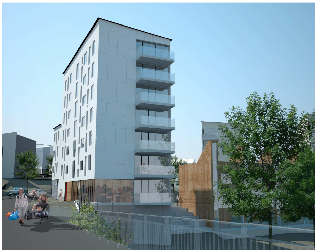
Perspektiv från Bällstabron

Förråd i eller i direkt anslutning till lägenheten är en god kvalité som bör utnyttjas. Om förråd placeras i en separat grupp i källare bör denna grupp vara tillgänglig från den egna lägenhetens trapphus. Garage anordnas under gård med bjälklag som möjliggör planteringar på gård. Garaget nås invändigt från samtliga trapphus. Cykelrum är att föredra framför skärmtak på gård. För områdets mest frekventa avfallsfraktioner anläggs ett lokalt sopsugsystem. Huvuddelen av inkasten placeras i anslutning till trapphusentréer. Övriga avfallsfraktioner placeras i traditionella soprum inom kvarteret.