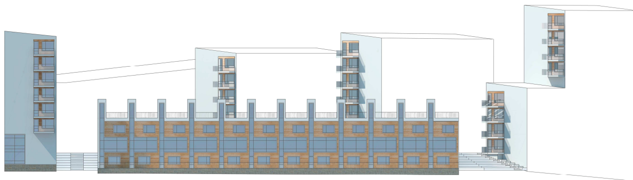
Fasader mot Bällstaån