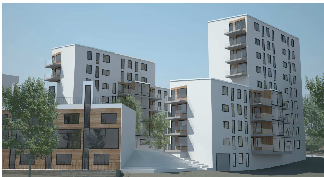
Perspektiv från nordöst