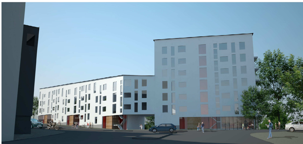
Perspektiv från Karlsbodavägen

Kvarterets strategiska läge som "port" in till stadsdelen innebär att det är viktigt med en stadsmässig representativ arkitektur med högklassig detaljering. Fasader mot Bällstavägen utförs med sockel av förslagsvis naturstenstyp som markerar entréplan samt entrépartier och lokaler i bottenvåningen som öppnar huset mot gatan. Entréer och lokaler markeras med varma kulörer, glaspartier och avvikande material, förslagsvis keramiska plattor (alternativt trä). På gården karaktäriseras bebyggelsen av rena slanka volymer i souterräng som varierar i våningsantal. 9-våningsfasaden mot parken ges en noggrann bearbetning där skalan bryts ned för att undvika ett alltför monumentalt intryck. I de fyra nedre våningarna binds burspråk och balkonger samman för att skapa en nödvändig mellanskala. Den volym som burspråken utgör utformas så att den anknyter till radhusens fasader mot Bällstaån, för att därigenom binda samman kvarteret.