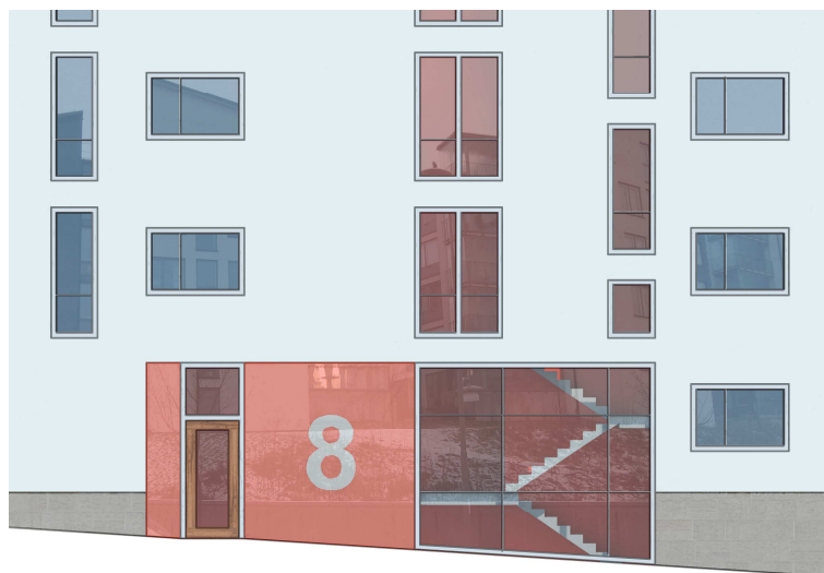
Fasad mot Bällstavägen, utformning av entré