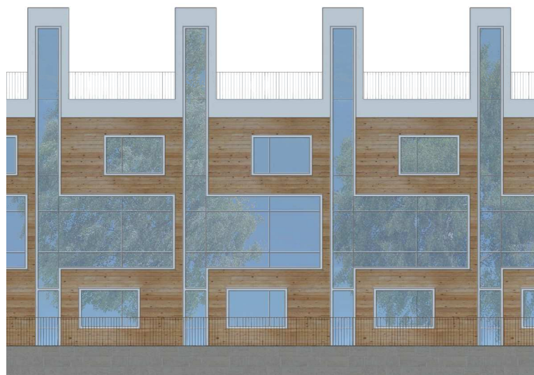
Fasad mot Bällstaån, radhusbebyggelse

Balkongfronter utförs med transparent karaktär och med hög estetisk och materialmässig kvalitet. Utblickar mot vatten och västersol eftersträvas. Eventuella inglasningar av balkonger utförs utan vertikala profiler och endast då tak finns ovan balkongen. Radhusens terrasser och eventuella balkonger får pinnräcken i smide.