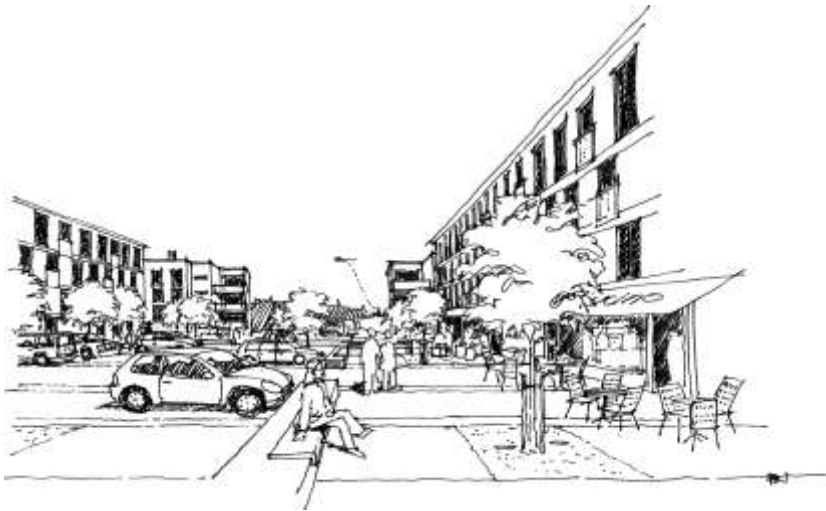
Perspektiv av torg