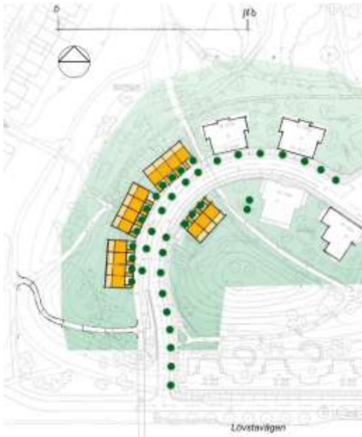
Radhus i norr mot befintliga småhus