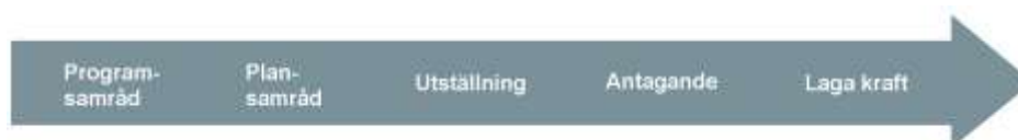
Illustration – normalt planförfarande med program

Detaljplaner antas av kommunfullmäktige. Fullmäktige får dock uppdra åt kommunstyrelsen eller byggnadsnämnden att anta planer som inte är av principiell beskaffenhet eller i övrigt av större vikt. Kommunens beslut att anta en detaljplan får överklagas av den som är berörd av beslutet och som senast under utställningstiden framfört synpunkter som inte blivit tillgodosedda.