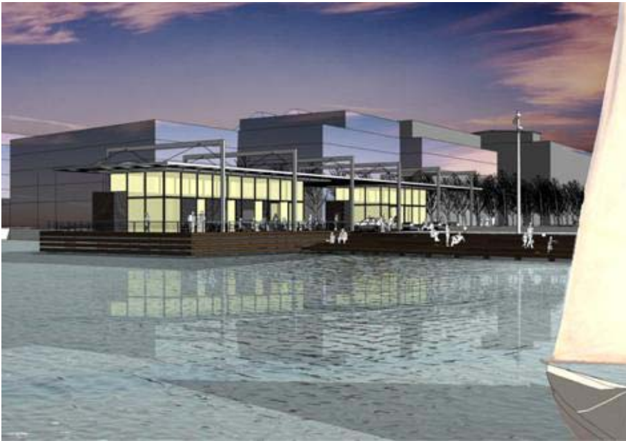
Trappan och restaurangpaviljongen sett från Ulvsundasjön