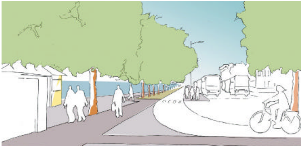
Figur 3 Perspektiv över bussupställningen