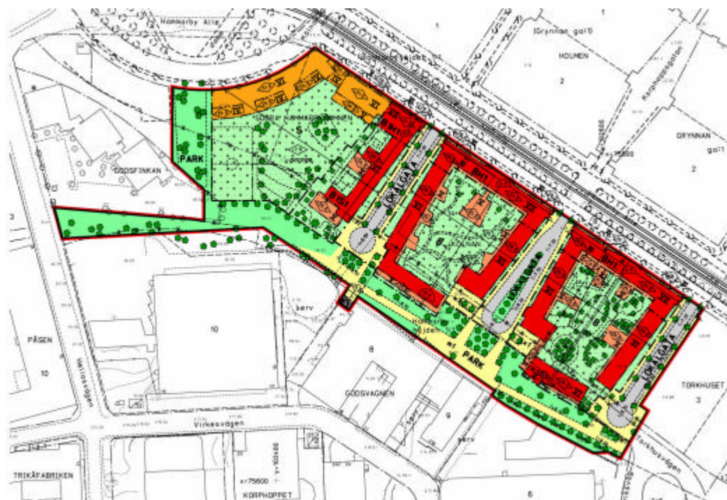
Situationsplan Kölnan, Stockholms stadsbyggnadskontor, 2002

Bristen på parkeringsplatser i Hammarby Sjöstad är idag den viktigaste och i stort sett enda punkten som de boende i Sjöstaden klagar på. Enkätundersökningar i Hammarby Sjöstad har visat att 27 % av hushållen idag står i kö för p-plats. 44 % av hushållen med bil står i dag på den provisoriska parkeringen på Lugnet som kommer att upphöra delvis hösten 2004 och helt under hösten 2005. I och med att de provisoriska parkeringsplatserna inom Lugnet och Kölnan/Sjöstadporten nu försvinner när områdena bebyggs blir garageanläggningen i Kölnan ett nödvändigt komplement för de västra delarna av Hammarby Sjöstad.