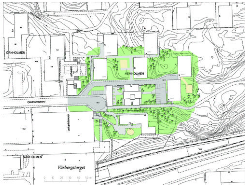
Situationsplan i förminskad skala

De föreslagna husen bedöms påverka parkstråket i södra kanten positivt genom att öka tryggheten i denna centrurnära del.