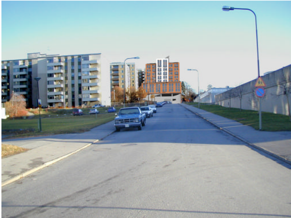
Fotomontage från väster