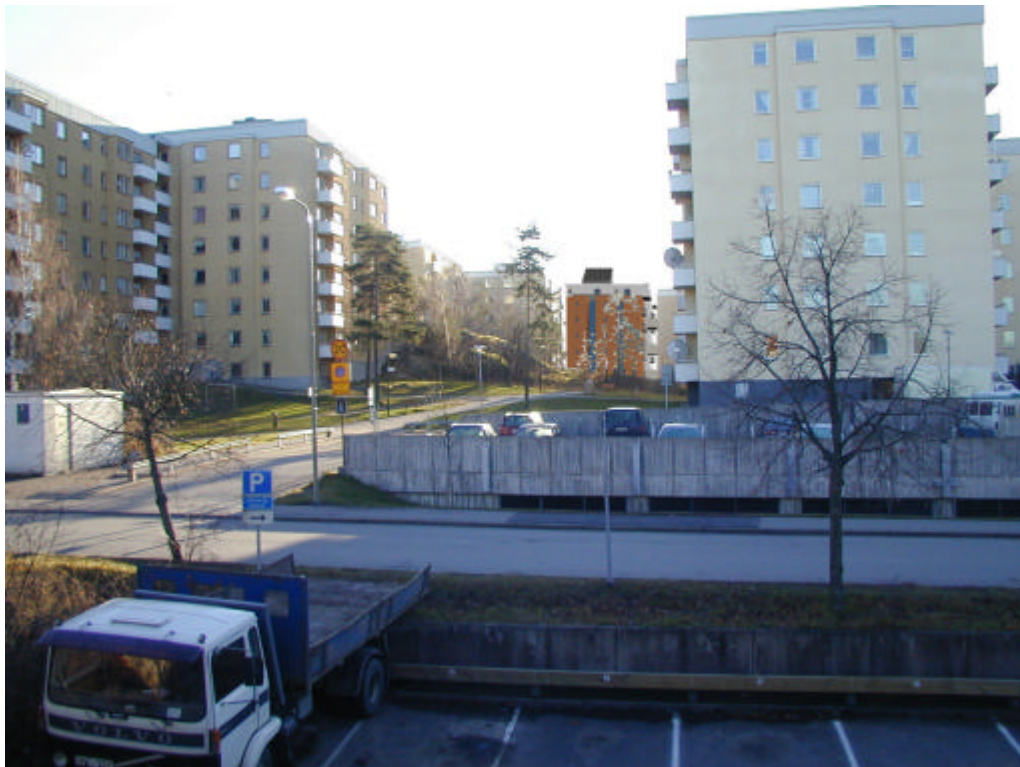
Fotomontage från norr