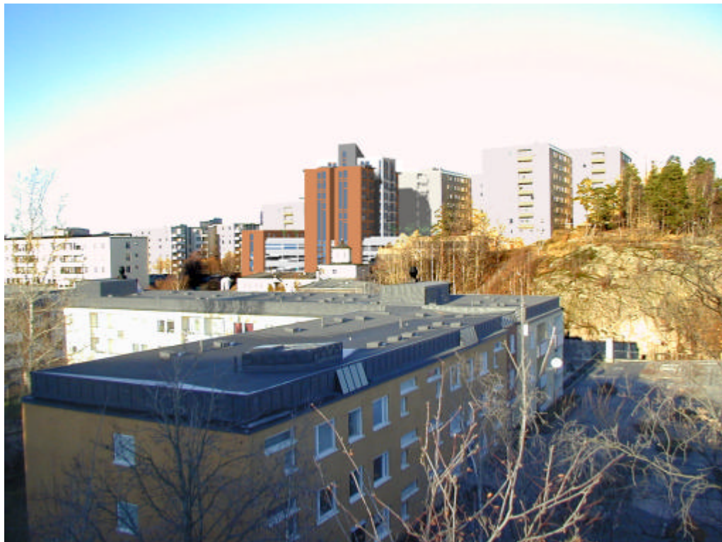
Fotomontage från söder