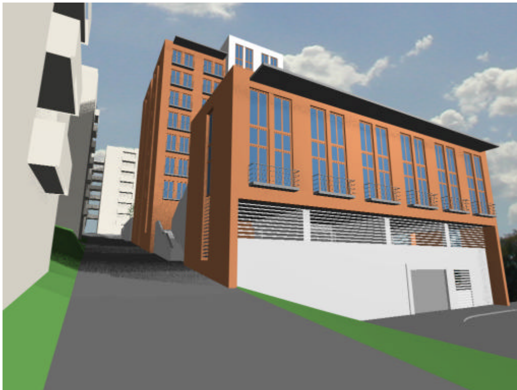
Perspektiv från entrévägen