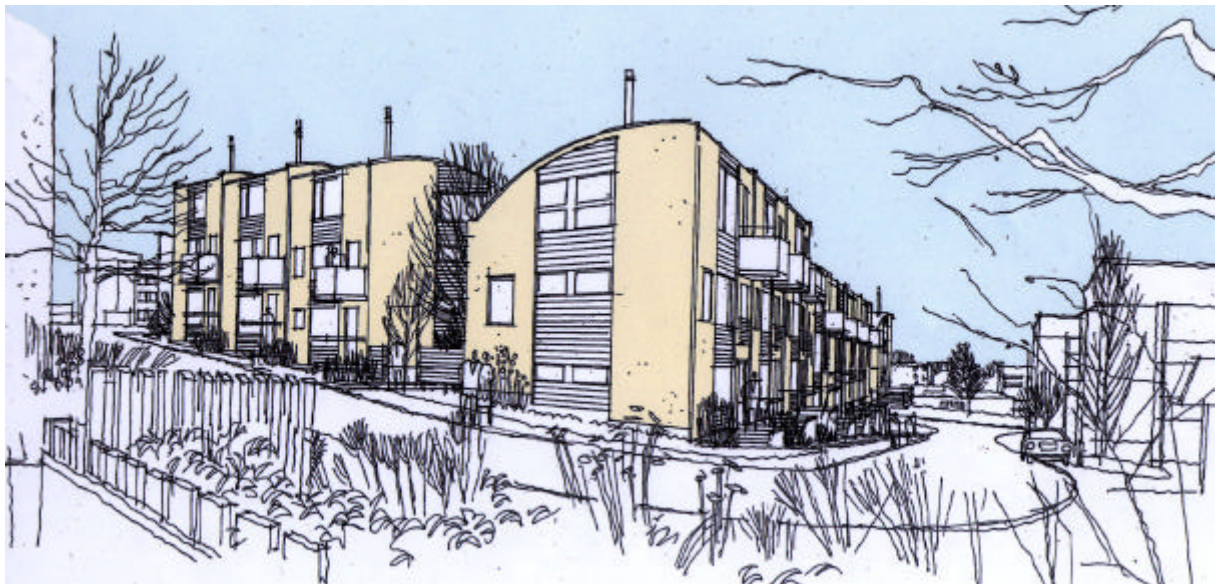
Fasader mot Edingekroken

På det övre parkeringsdäcket föreslås 16 radhus. Det undre planet föreslås även fortsättningsvis nyttjas för parkering. Radhusen kragar ut över däckets kant och står delvis på marken och döljer därmed stora delar av den grå betonganläggningen. Byggnadssättet prövas nu i kv Handkvarnen i Rinkeby. Det höga och soliga läget ökar radhusens attraktivitet. Om det visar sig nödvändigt att behålla den befintliga stortvättstugan och elnätstationen utgår 4-5 radhus. Kvarvarande parkeringsplatser räcker för att tillgodose parkeringsnormen vid nybyggnad i ytterstaden.