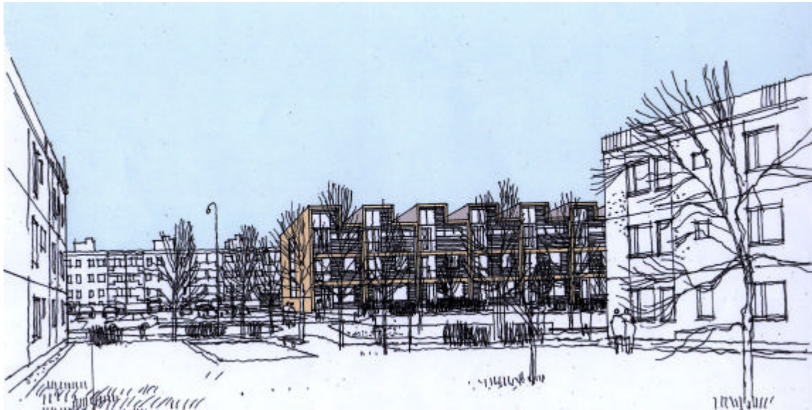
Fasader från kv Hasslinge

Tensta 4:8 har föreslagits för bostadskomplettering i samtliga inventeringar som gjorts för området. Sju radhus föreslås på parkeringsplatsens östra del. Den andra hälften av parkeringsplatsen nyttjas även fortsättningsvis för parkering och kanststensparkering föreslås tillåtas längst med Elinsborgsbacken. Området ligger på den högsta platsen i Tensta och radhusen inplaceras så att utsikten tas tillvara. En fin utsikt brer ut sig åt öster där husen längst med Skäftebacken trappas ned.