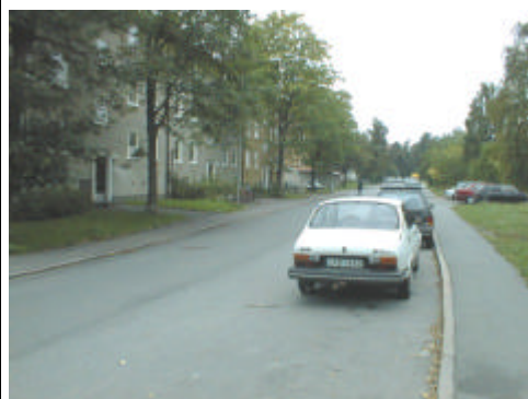
Fogdevägen – östra delen. Sträckan förbi flerfamiljshusen (Riksrådsvägen – Rusthållarvägen).