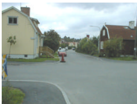
Fogdevägen – västra delen. Sträckan förbi villorna (väster om Riksrådsvägen)