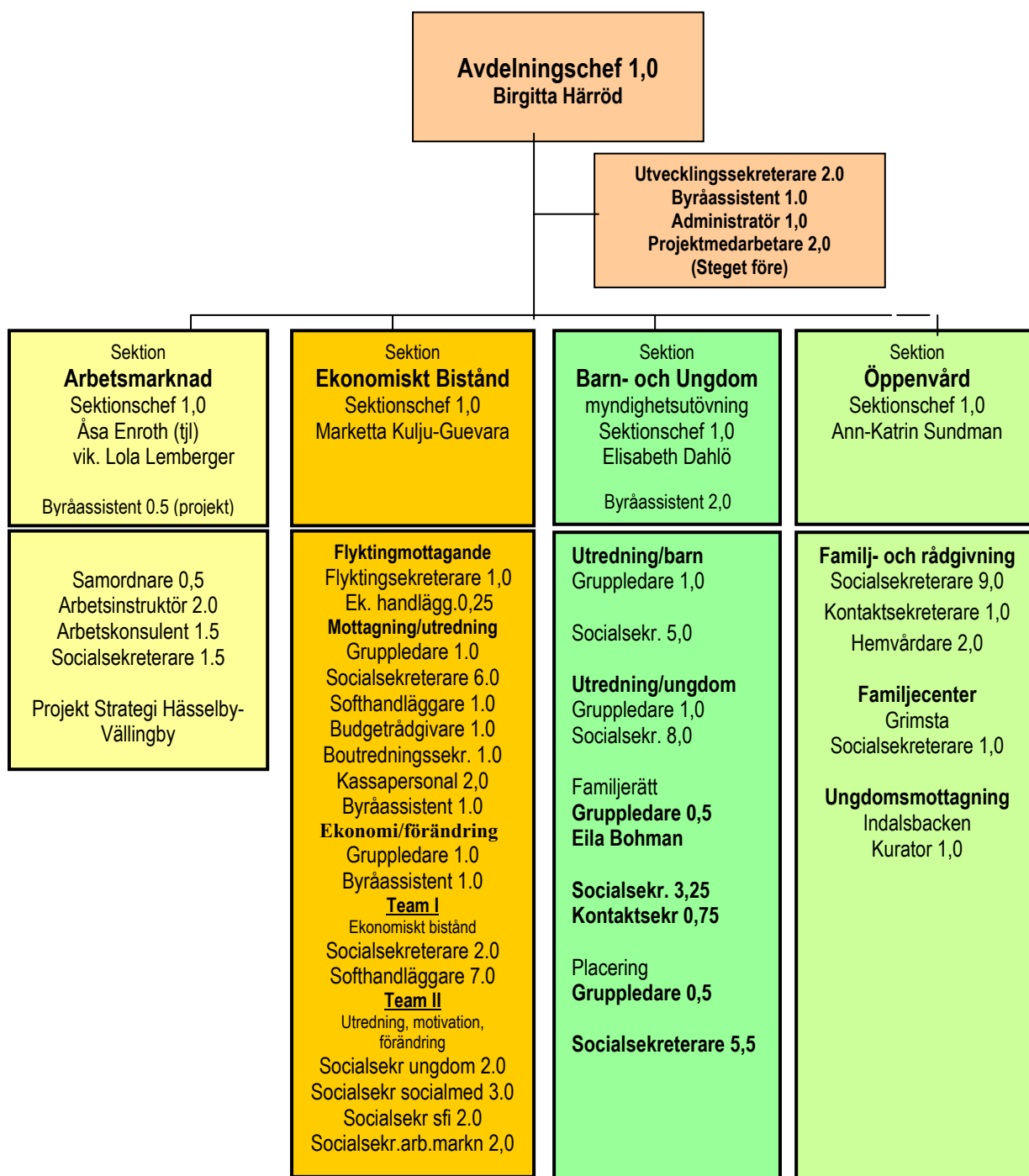
Figur 3. Organisationsskiss Individ- och familjeomsorgen, Barn & ungdom, arbete & bistånd, Hässelby-Vällingby stadsdelsförvaltning 2005-01-03

En betydande omorganisation har skett inom IoF i Hässelby-Vällingby under projektets gång. Den nya organisationen för Individ- och familjeomsorgen som trädde i kraft 1 september 2004 ser ut som följer: