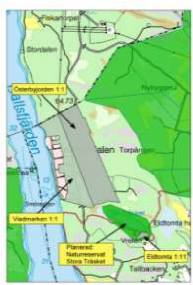
Kungsdalen och Stora Träsket

Fastigheterna är idag samtaxerade med flera andra fastigheter – ett bedömt taxeringsvärde för fastigheterna Viadmarken 1:1, Österbyjorden 1:1 och Eldtomta 1:11 uppgår till 1.900.000 kronor. Bokfört markvärde uppgår till 1.511.840 kronor.