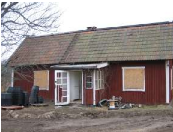
Senaste användning: Förråd, 96 kvadratmeter.