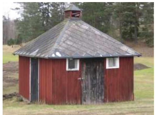
Uthus, 12 kvadratmeter