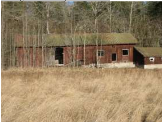
Lada, 250 kvadratmeter