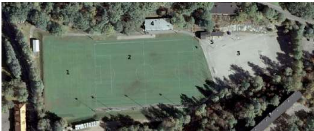
Bild 1. Nr 1 visar befintlig 7-manna gräsfootbollsplan, nr 2 befintlig 11-manna gräsfootbollsplan, nr 3 befintlig 7-manna grusplan. Nr 4 visar byggnad vars övervåning är tänkt att renoveras och nr 5 visar byggnad som planerar att rivas.

Beslutet gäller anläggande av tre konstgräsplaner samt byggnation av en ny personalbyggnad på Hjorthagens idrottsplats. Det gäller också renovering och iordningsställande av en servering och tre omklädningsrum i de utrymmen som varit personalutrymmen samt att befintlig serverings- och förrådsbyggnad, som är i mycket dåligt skick, rivs.