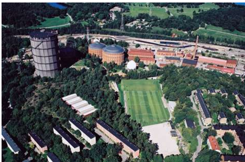
Bild 3. Flygbild över idrottsplatsen och gasverksområdet, Norra Djurgårdsstaden

Tre konstgräsplaner byggs: en 11-manna, en 7-manna och en 5-manna liksom ny planbelysning. En fuktskadad byggnad rivs och en ny byggs på dess ställe. Befintlig omklädningsbyggnad renoveras.