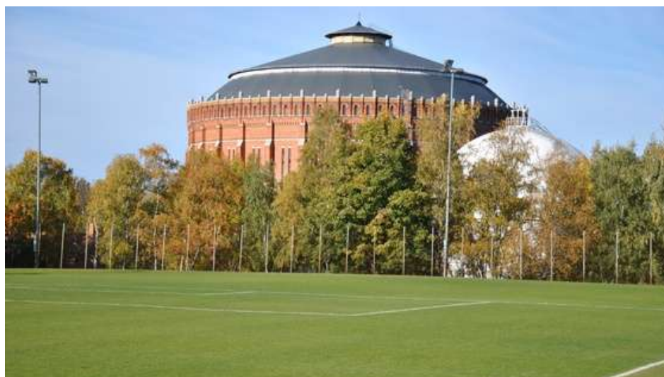
Bild 4. 11-mannaplanen och en av gasklockorna i Norra Djurgårdsstaden

Den tältentreprenad som Djurgårdens IF för närvarande förbereder för 11-mannaplanen kan komma att påverka fastighetskontorets projekt vad gäller omfattning, teknik, design, ekonomi, kvalitet och tider. Samordning, kommunikation och kontroll är viktig för att minimera dessa risker.