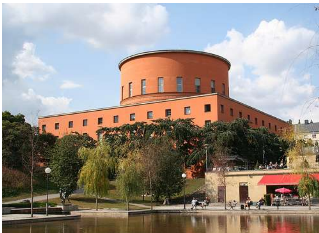
Figur 3 Asplundshuset, Stadsbibliotekets huvudbyggnad

Vidare pågår projekt - så som vårdprogrammet och planerande av ny entré till tågstationen - som påverkar de aktuella fastigheterna och det finns därför ett behov av att se över konsekvenser och möjligheter som dessa för med sig. Fastighetskontoret och kulturförvaltningen har stämt av dessa planer med stadsbyggnadskontoret.