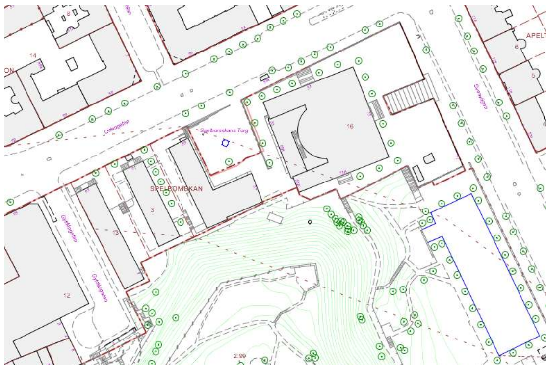
Figur 2 Kvarterens namn och nummer

Fastighetskontoret äger fastigheterna Spelbomskan 3, 13 och 16 där kulturförvaltningen är den största hyresgästen. Kulturförvaltningen hyr Asplundshuset (huvudbyggnaden) och Annexet för Stockholms stadsbiblioteks räkning.