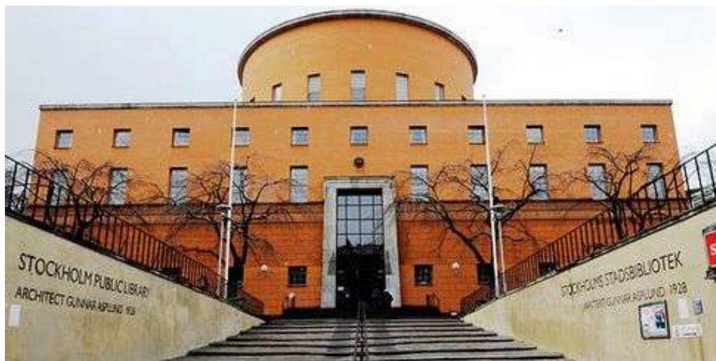
Figur 5 Stadsbibliotekets huvudentré

Om länsstyrelsen har godkänt planen kan åtgärder som ligger i linje med denna hanteras utan länsstyrelsens tillståndsprövning.” Ett ytterligare förtydligande av anläggningens kulturhistoriska värden kan regleras med skydds- och varsamhetsbestämmelser i en eventuell ny detaljplan, om detta blir aktuellt.