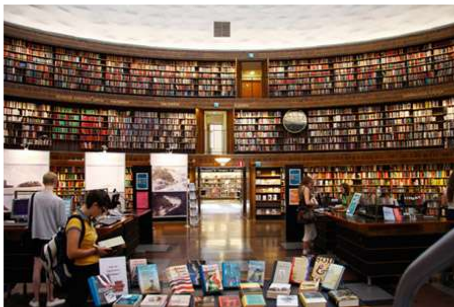
Figur 4 Stadsbibliotekets huvudbyggnad

I strävan att fortsätta att vara ett samtida, angeläget och använt bibliotek uppstår krokar. Behovet av att lära och läsa i lugn och ro kan inte alltid samsas med behov av upplevelser och samtal kring litteratur och andra ämnen. Ett exempel på det är att Rotundan som idag används som scen för alla större program och evenemang för både barn och vuxna, samtidigt som den är en del av det öppna biblioteket.