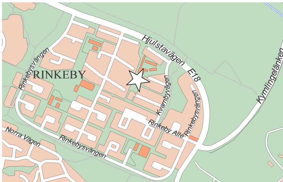
Översiktskartor Rinkeby norra stadspark

Under vintern och våren 2003 har arbete med att ta fram ett program för upprustningen av parken genomförts i samarbete med Stadsdelsförvaltningen, fastighetsägare och det lokala handikapprådet. Förslaget innebär i korthet att parkens vegetation ses över, belysningen kompletteras, fontäner och möbleringen i parken förnyas.