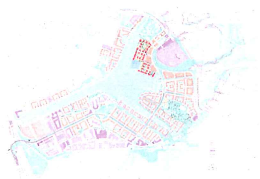
Utsnitt ur översiktlig plan för Hammarby Sjöstad med detaljplaneområdet

850 lägenheter varav 65 % bostadsrätter och 35 % hyresrätter Byggstart hösten 2007 Första inflyttning våren 2009