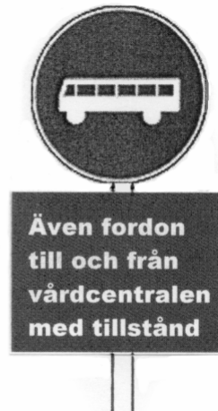
Förslag till ny skyltning

Tilläggsstavlan kommer att innebära att skyltningen respekteras i lägre grad, och om pollarna skulle stängas av eller sluta fungera får polisen svårare att övervaka smittrafik med den nya skyltningen än med den gamla. Nämnden har tidigare givit kontoret i uppdrag att reparera de automatiska pollarna och starta upp dem igen. Detta arbete pågår. För att möjliggöra för trafik att köra ned på kajplanet måste vårdcentralen få möjlighet att öppna pollarna för behörig trafik via fjärrstyrning. Kontoret bedömer att en sådan fjärrstyrning bör kunna fungera rent tekniskt, men att det blir svårare att hindra olovlig trafik på kajen med denna lösning.