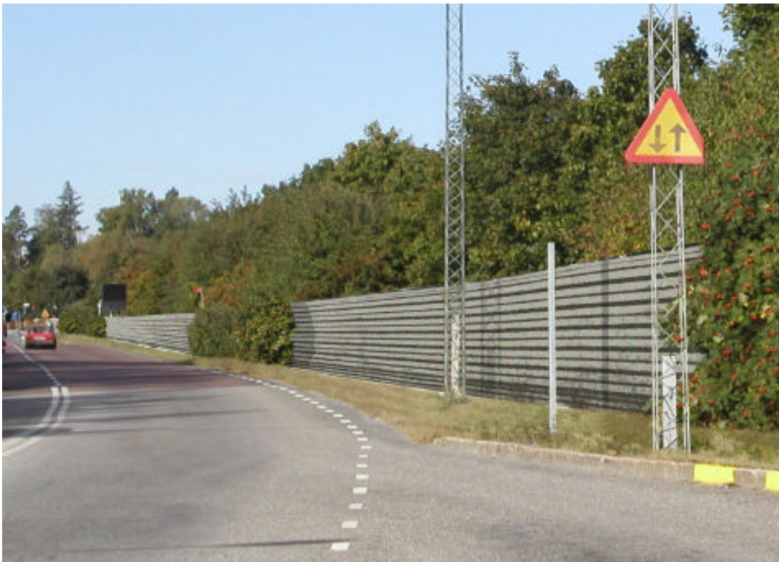
Fotomontage: Färd västerut vid Skattegårdsvägen

Utgångspunkten har varit att etablera en bullerskärm med ”lät” karaktär