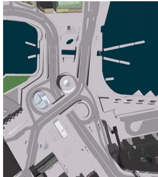
Något mindre trafikytor