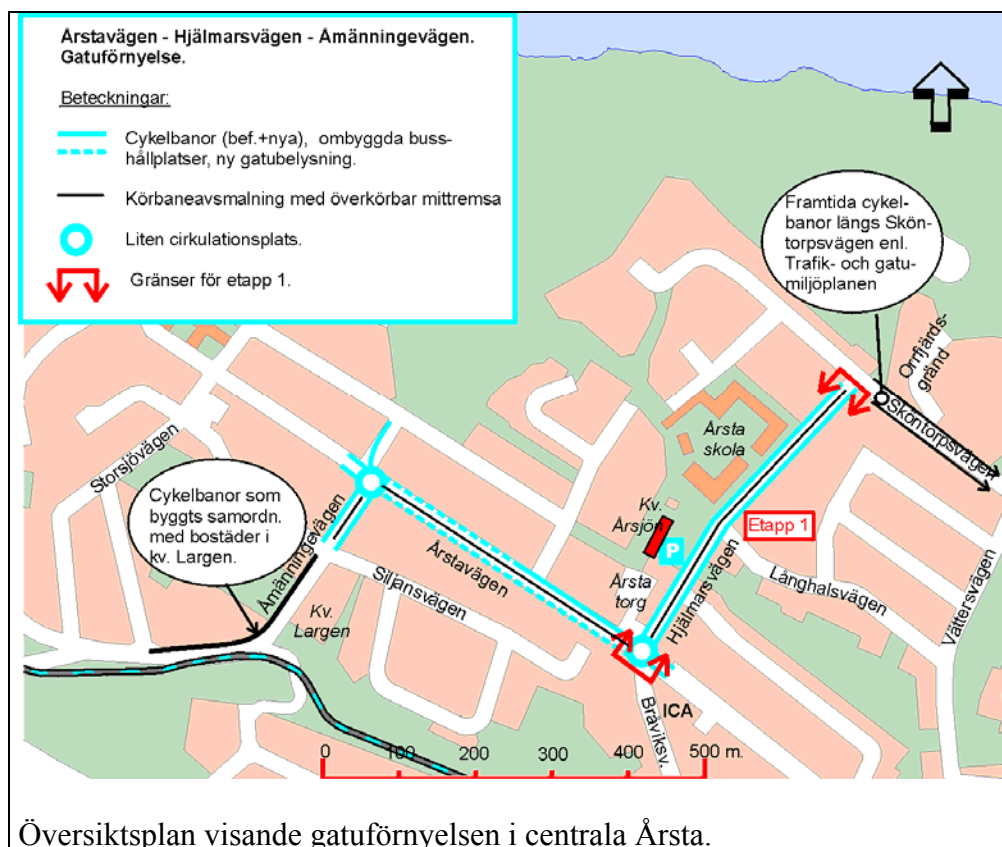
Översiktsplan visande gatuförnyelsen i centrala Årsta.

Enligt genomförandebeslut i fd. gatu- och fastighetsnämnden genomför trafikkontoret nu ombyggnader av huvudgatustråket genom centrala Årsta. Berörda gator framgår av nedanstående figur: